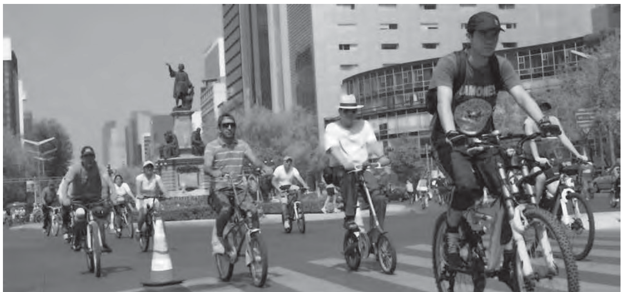
Foto 10. Paseo de la Reforma: un paseo en bicicleta, donde está presente el respeto al ciclista y el de éste hacia la ciudad. Fuente: http://noticias.terra.com.mx/mexico/estados/celebran-5-anos-de-paseos-dominicales

Fotos 8 y 9. Paseo de la Reforma: este recorrido, principalmente en bicicleta, ha tenido gran éxito entre los habitantes de la ciudad y sus visitantes, evidente por el porcentaje de asistentes. Durante el recorrido se llevan a cabo diversas actividades de ejercicio al aire libre, acompañadas de música, lo cual crea un ambiente divertido, festivo, saludable, de encuentro, convivencia e integración entre distintos grupos económicos de población Fuente: http://sipse.com/noticia.php?ID_NOTICIA=18586 .