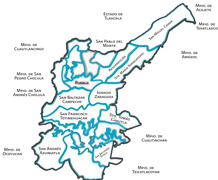
FIGURA 1. PLANO INDICATIVO DE LOS LÍMITES DE MUNICIPIOS ANEXADOS CON EL DECRETO DEL H. CONGRESO DEL ESTADO DE PUEBLA DEL 6 DE SEPTIEMBRE DE 1962.

Una parte importante de estas colonias se localizaban en la periferia urbana. Sabemos que, dado el proceso de expansión y dispersión al que ha respondido el comportamiento del espacio urbano en el municipio de Puebla, como resultado de la estrategia puesta en marcha en la década de los años sesenta de anexar territorios de municipios aledaños al de la capital poblana y, contrario a lo planteado por aquel decreto, 1 el resultado ha sido alta marginación social y vulnerabilidad territorial.