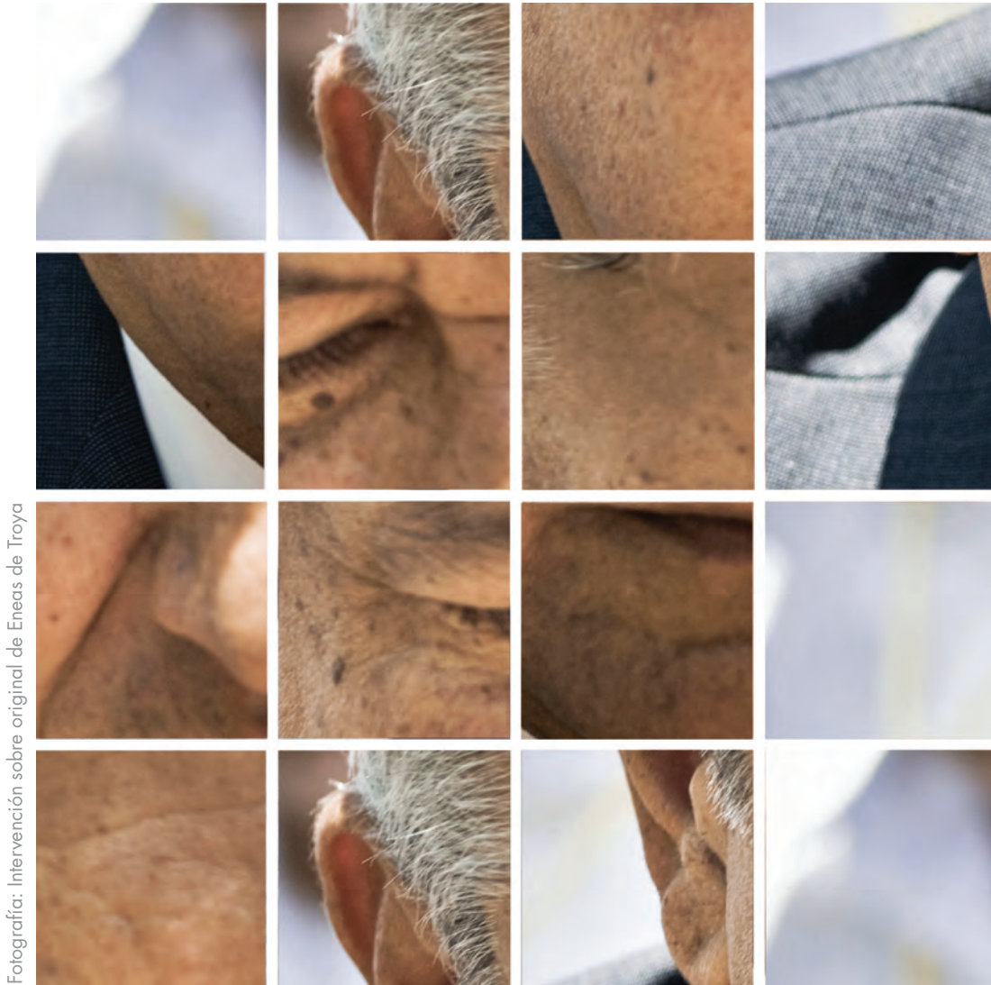
Fotografía: Intervención sobre original de Eneas de Troya