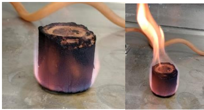
Fig. 6 y 7. Muestra de briqueta entrando en combustión

Con respecto a la combustión, se pudo confirmar que las muestras de briqueta del aserrín/polvo de madera de la universidad, con la cera de soya y la maicena pueden entrar en combustión al entrar en contacto con el fuego, como se observa en la Fig. 6 y 7.