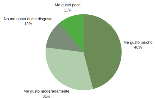
Fig. 3. Gráfica de Análisis sensorial.

Los datos obtenidos a través del análisis sensorial indicaron un promedio general (tomando en cuenta su textura, color y sabor) que al 46% de las personas les gustó mucho, al 31% les gustó moderadamente, al 12% no les gusta ni les disgusta, al 11% les gustó poco y por último al 0% le disgustó mucho (Fig. 3). Además, al 94% de las personas que realizaron nuestra encuesta les gustaría comprar nuestras tostadas. Los resultados fueron nuevamente positivos; sin embargo, se debe buscar una forma para mejorar el color de la tostada y que sea más atractiva visualmente para las personas.