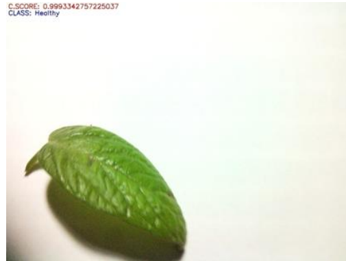
Fig.5. Hoja detectada como saludable con un nivel de confianza de 99.3%.