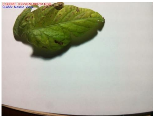
Fig.4. Hoja detectada como infectada con un nivel de confianza de 97.9%.