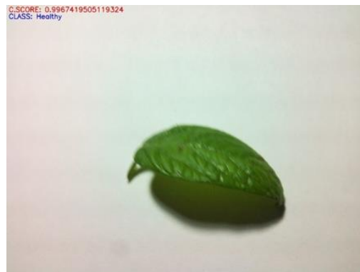
Fig.6. Hoja detectada como saludable con un nivel de confianza de 99.7%.