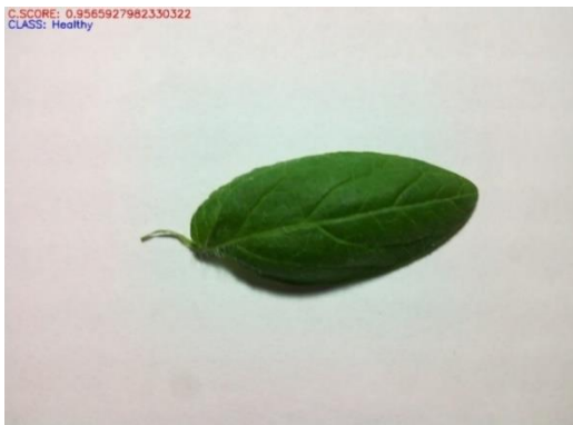
Fig. 3. Hoja detectada como saludable con un nivel de confianza de 95.7%.

La implementación exitosa de este sistema de monitoreo representa un avance significativo en la agricultura moderna. Aunque la perfección absoluta puede ser difícil de alcanzar, la combinación de inteligencia artificial y la experiencia humana proporciona una herramienta poderosa para mejorar la gestión de enfermedades en los cultivos. Este sistema no solo fortalece la resiliencia de los agricultores ante posibles brotes, sino que también sienta las bases para futuros desarrollos en el campo de la agricultura de precisión.