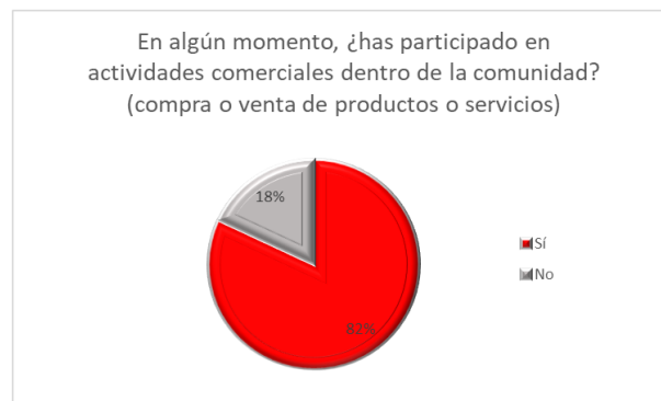
Fig 1: Porcentaje de personas que participan en actividades comerciantes dentro de la UIA

Primero se midió el nivel de compra – venta de los estudiantes para conocer el ritmo de la actividad comercial, esto ayudó a concluir que existe un mayor porcentaje de compra de productos que de estudiantes emprendedores; las razones de esta diferencia es la existencia de limitaciones de tiempo, ya que algunas personas no disponen de tiempo para crear y administrar un negocio, también podría ser por falta de recursos, falta de orientación y de apoyo.