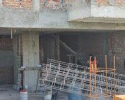
Fig. 1: Entrada principal de la obra de casa-habitación ubicada en Lomas de Angelópolis sección 3.