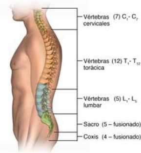
Fig. 3: Anatomía ósea de la espalda donde se observa la columna vertebral [14].

Los huesos que conforman la estructura de la espalda desempeñan la función principal de proporcionar soporte, constituyendo lo que conocemos como la columna vertebral. La columna vertebral está compuesta por vértebras que se encuentran unidas por discos esponjosos, esenciales para prevenir la fricción entre los huesos y permitir la flexibilidad necesaria para los movimientos cotidianos [14]. En la Fig. 3 se puede observar las vértebras que conforman la columna vertebral.