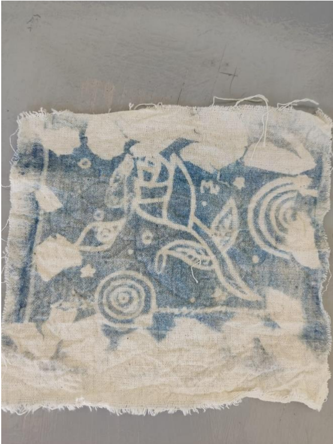
Ilustración 20 Cianotipia final participante 5