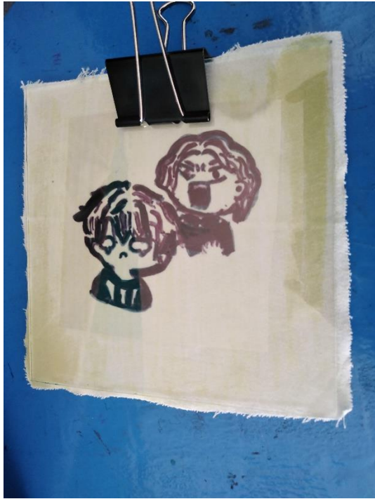
Ilustración 11 Preparación acetato 1