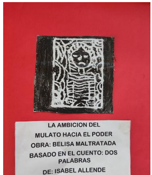
Ilustración 9 Grabado final participante 4