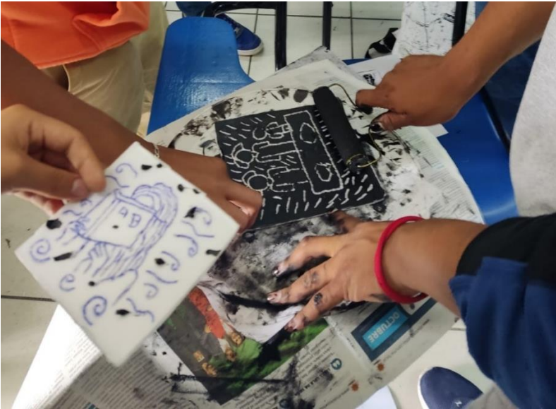
Ilustración 3 Entintado de grabado 1