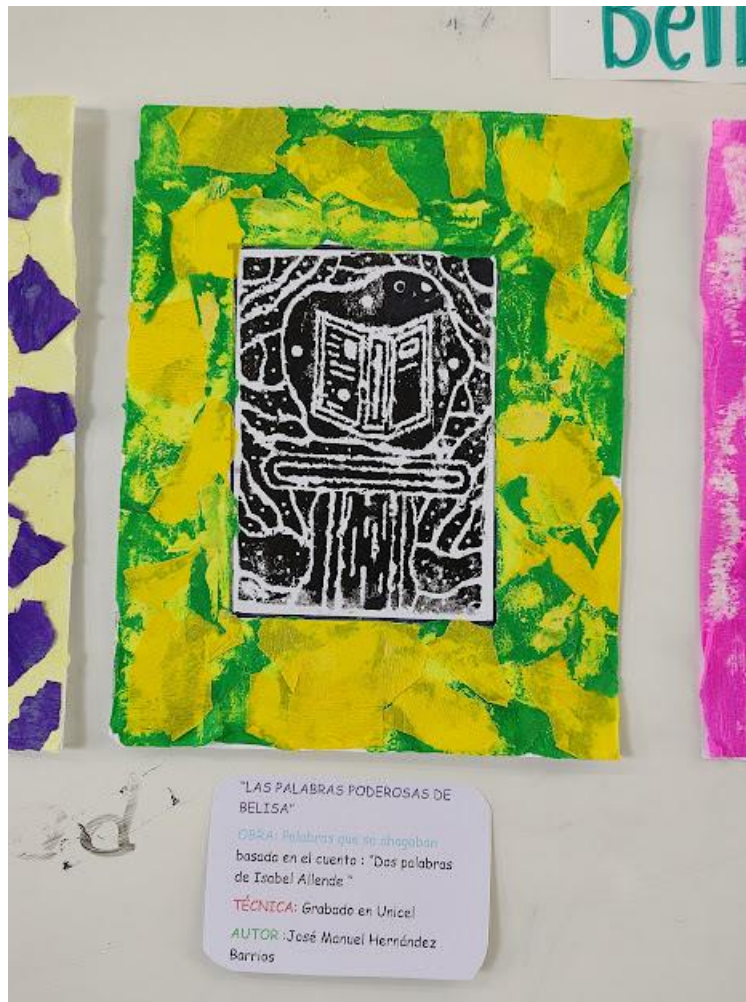
Ilustración 10 Grabado final participante 5

Una vez que los estudiantes elaboraron su impresión, montarán su obra a manera de exposición y explicarán su obra a partir de las siguientes preguntas: