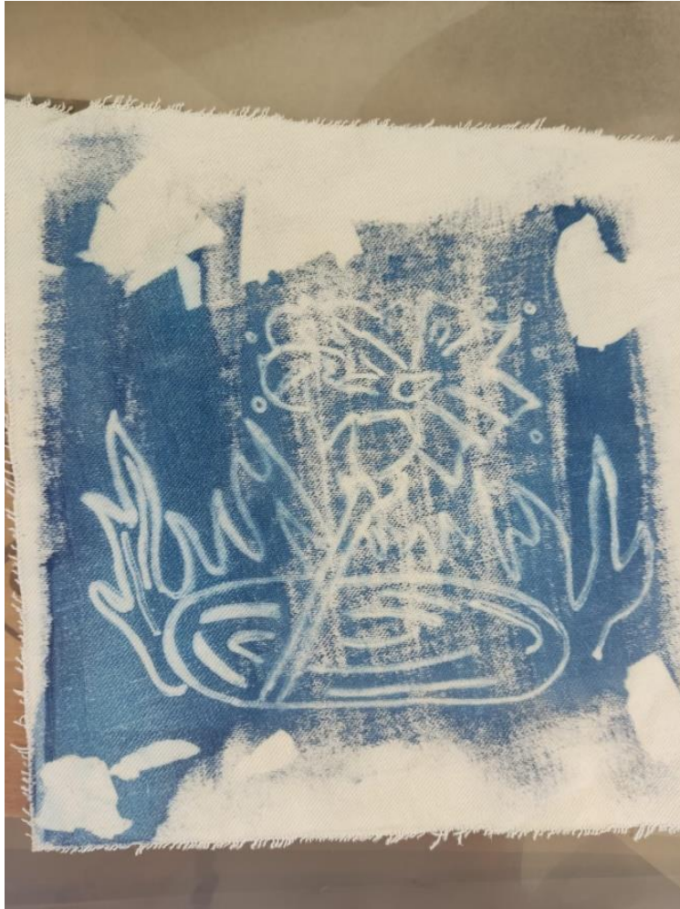
Ilustración 16 Cianotipia final participante 1