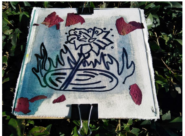
Ilustración 14 Proceso de oxidación 2