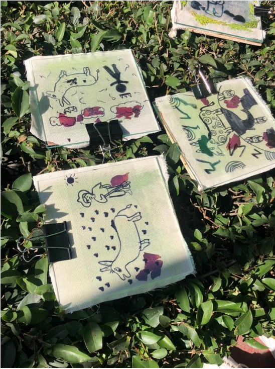
Ilustración 13 Proceso de oxidación 1