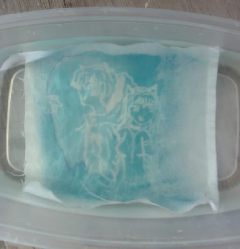
Ilustración 15 Proceso de revelado con sales