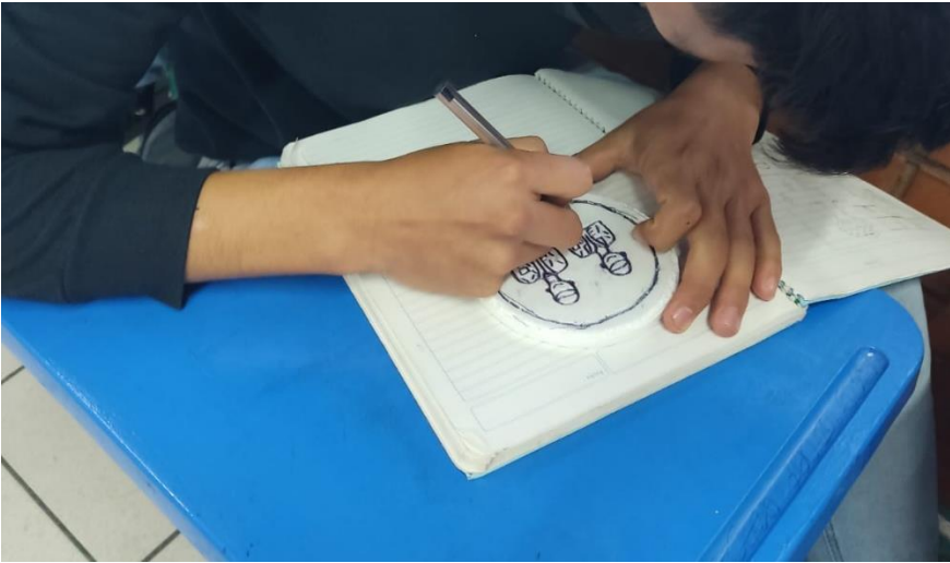
Ilustración 2 Creación de grabado 2