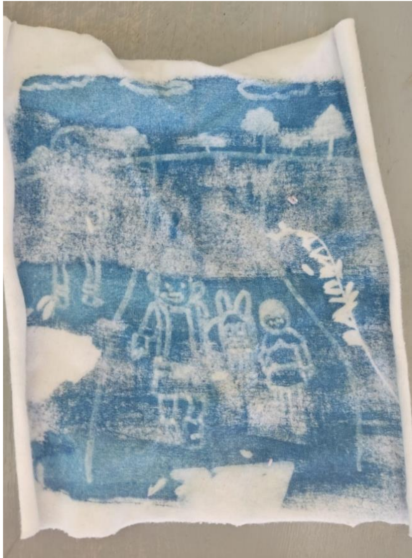
Ilustración 18 Cianotipia final participante 3