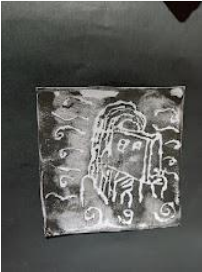
Ilustración 8 Grabado final participante 3