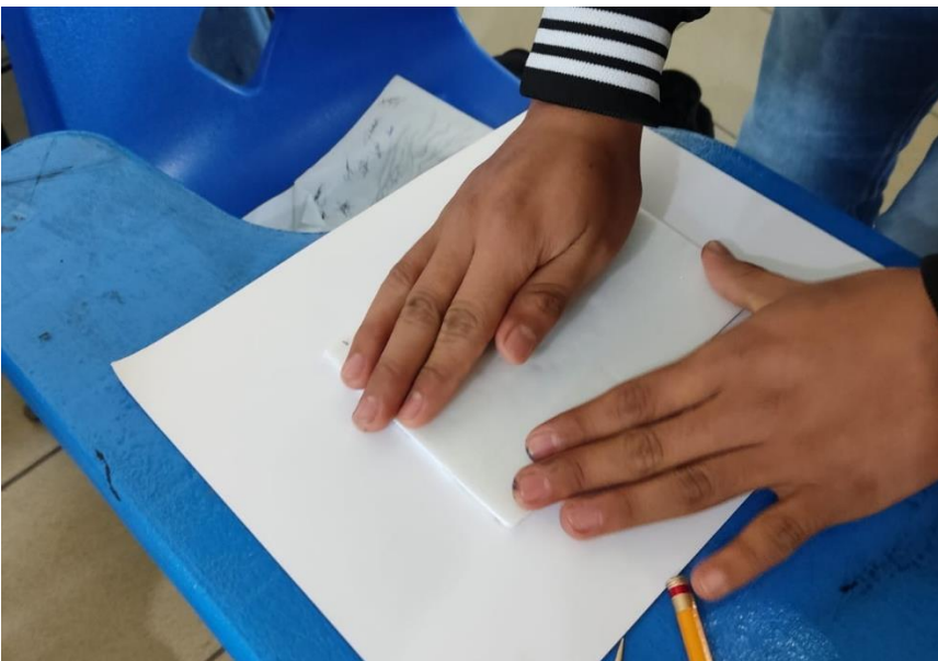
Ilustración 5 Impresión de grabado