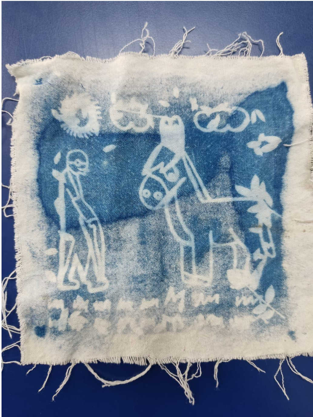
Ilustración 19 Cianotipia final participante 4