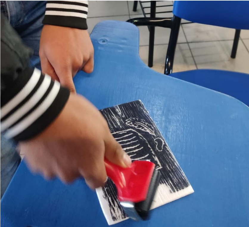
Ilustración 4 Entintado de grabado 2