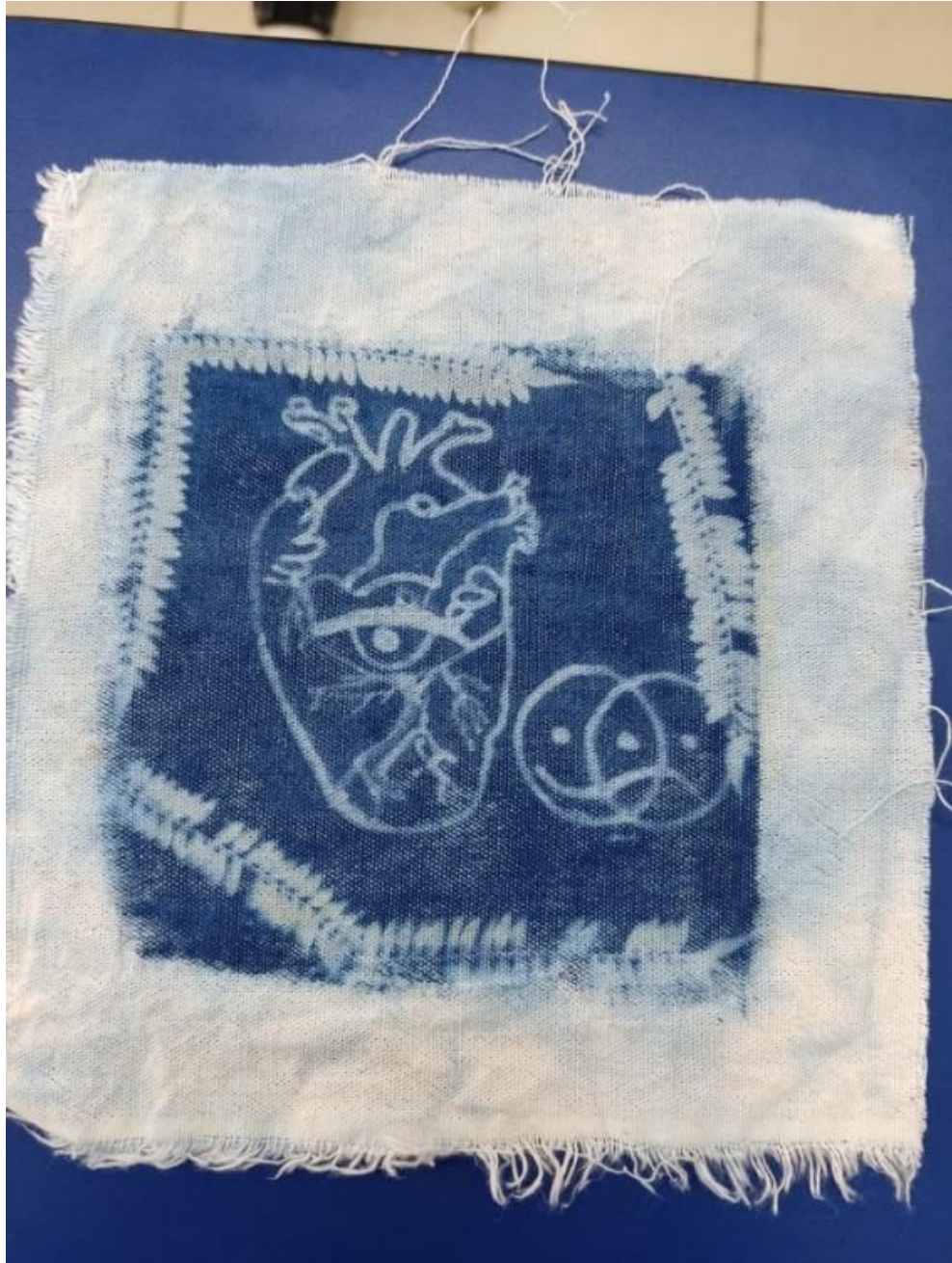
Ilustración 17 Cianotipia final participante 2