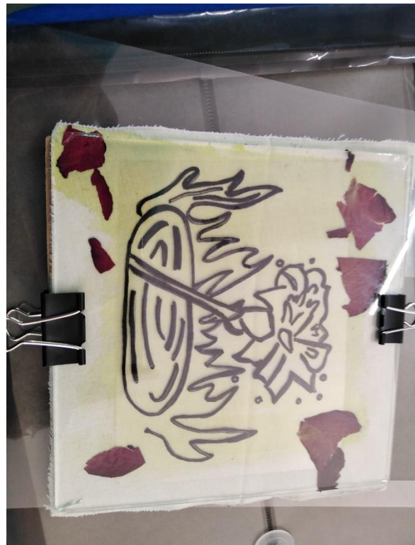
Ilustración 12 Preparación acetato 2