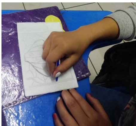
Ilustración 1 Creación de grabado 1