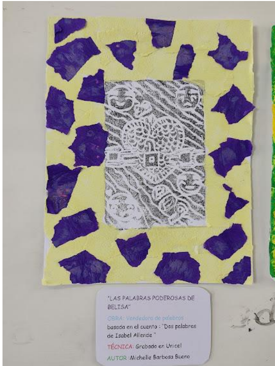
Ilustración 6 Grabado final participante 1