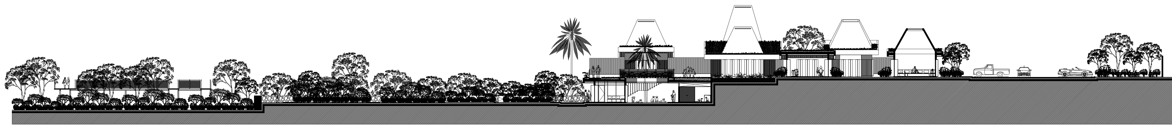
Corte General Transversal Y-Y'