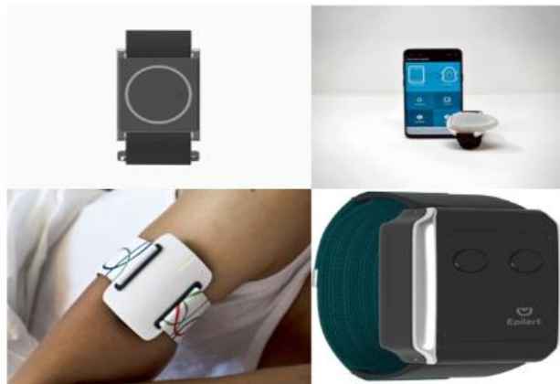
Fig. 1. Dispositivos existentes para detectar crisis convulsivas.

ante una posible crisis convulsiva. Estos brazaletes mandan una alerta vía Bluetooth a una aplicación en el momento en el que comienza la convulsión. Sus precios oscilan entre $3 930 y $28 033 pesos mexicanos y pueden ser adquiridos en las páginas web oficiales de las empresas que los fabrican. Sin embargo, no existe un dispositivo creado en México que esté al alcance de la población mexicana con epilepsia. Por este motivo, es importante crear herramientas efectivas y accesibles que ayuden a evitar los riesgos posibles por una convulsión.