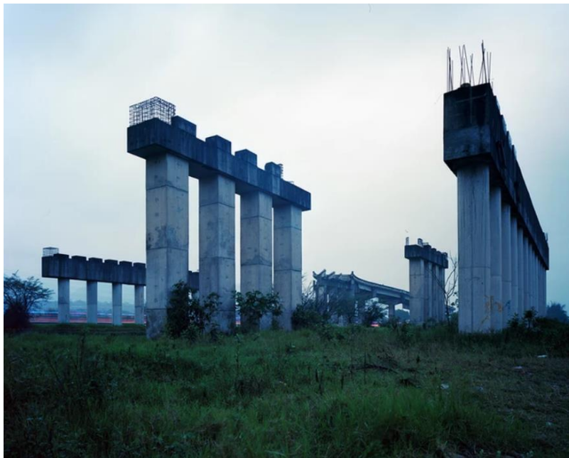
Ilustración 9 Patrick López Jaimes. "Inconcluso/Espacios Suspendidos II: Monumentos", 2014.

Inconcluso/Espacios Suspendidos II: Monumentos, 2014. De Patrick López Jaimes.