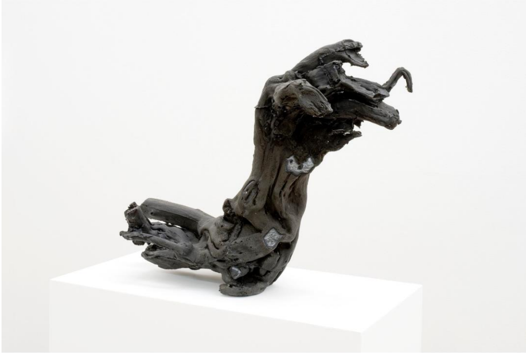
Imagen 5 Fischli & Weiss. "Rubber Sculptures", 1988.

Especialmente para los objetos tridimensionales que han sido recolectados hasta este punto del proyecto, las esculturas de goma del dúo suizo, figuran como uno de los grandes referentes en cuanto a su propuesta transversal: la transfiguración de lo cotidiano en un objeto de carácter escultórico, que intenta despertar cuestionamientos desde lo más básico como “¿por qué esto es arte?” hasta elaboraciones como “¿qué me dice este objeto?”, las cuales dan pie a preguntas más complejas como: