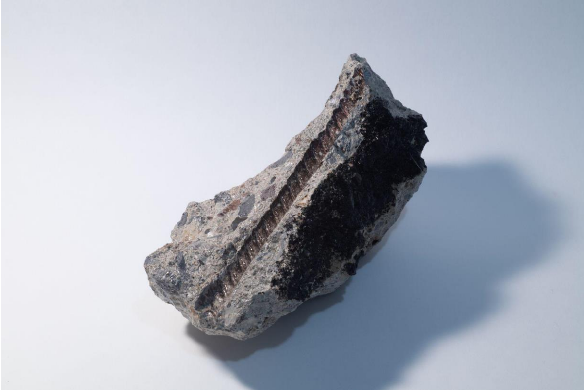
Fósil IV, varilla. 2022. Fotografía digital. Medidas variables. (Trozo de cemento con chapopote con marca de varilla de cobre. 236 x 290 x 182 mm)