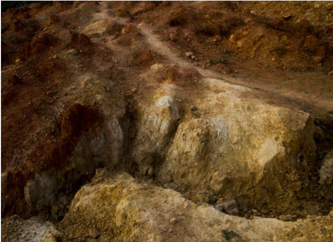
Imagen 4 Karina Juárez. "9 mil kilómetros". s/f.

9 mil kilómetros (s/f), de Karina Juárez.