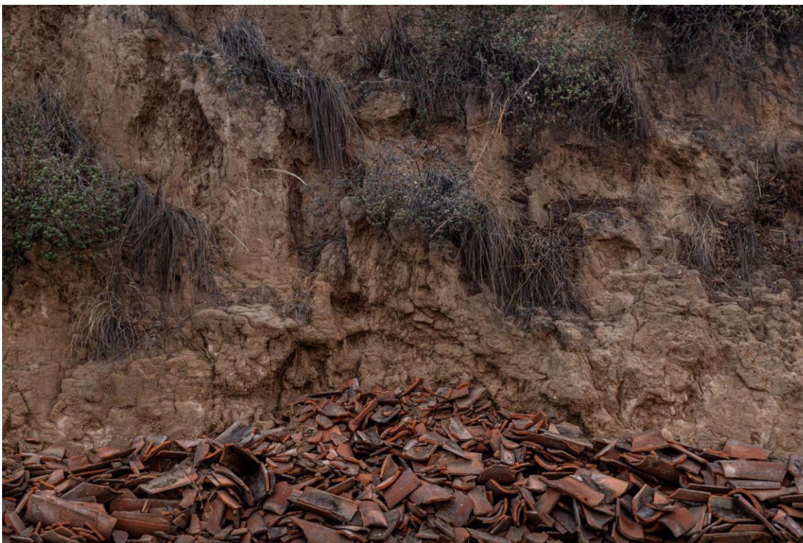
Incorporar el residuo, 2022. Fotografía digital. Medidas variables.

Como parte del desarrollo del proyecto, y encontrándose en su cuarto mes de realización, se presentan a continuación una serie de fotografías que retratan espacios, acciones y objetos que han sido recolectados tras distintos procesos, en los cuales se insiste en el análisis y la detección de la expansión urbana en relación con los entornos naturales y el Tercer Paisaje. De igual modo, se adjuntan algunos bocetos y descripciones generales sobre el producto cultural resultante (exposición) y las actividades comunitarias paralelas.