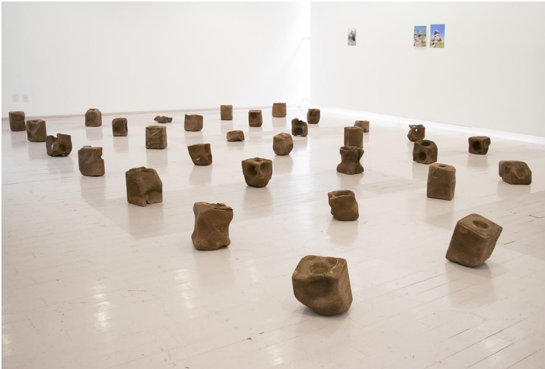
Ilustración 8 Miguel Fernández de Castro. "Licked time", 2016.

La disposición de elementos recolectados, que a su vez parten de una delimitación geográfica específica para generar narrativas sobre la territorialidad, parecen trasladarnos a los caminos que se transitan y la erosión que se vive (en Sonora, en este caso específico), pero sobre todo, nos aproximan a una narrativa sobre el desgaste y el tiempo, conceptos que también he abordado en otras ocasiones para la articulación de proyectos propios, principalmente fotográficos y performáticos.