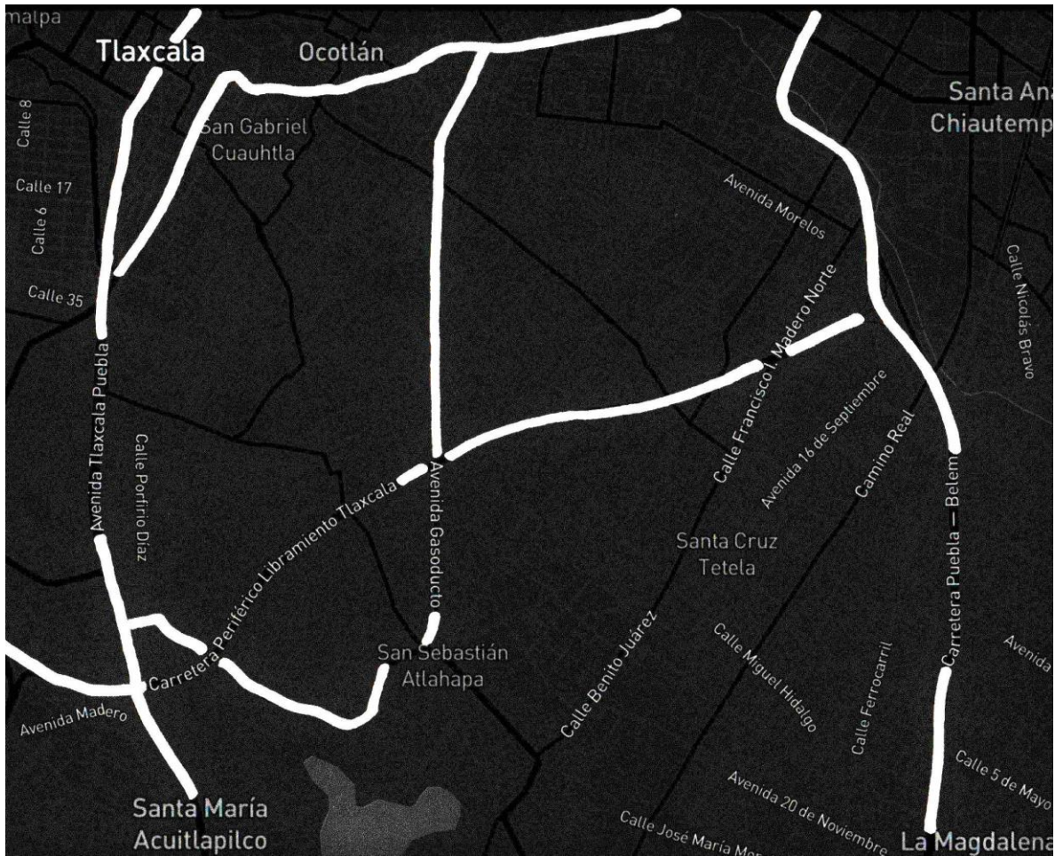
Mapeo 4. Ruta Ocotlán-Gasoducto-Atlahapa. 2022. Mapeo satelital vía Snazzy Maps intervenido. Medias variables.