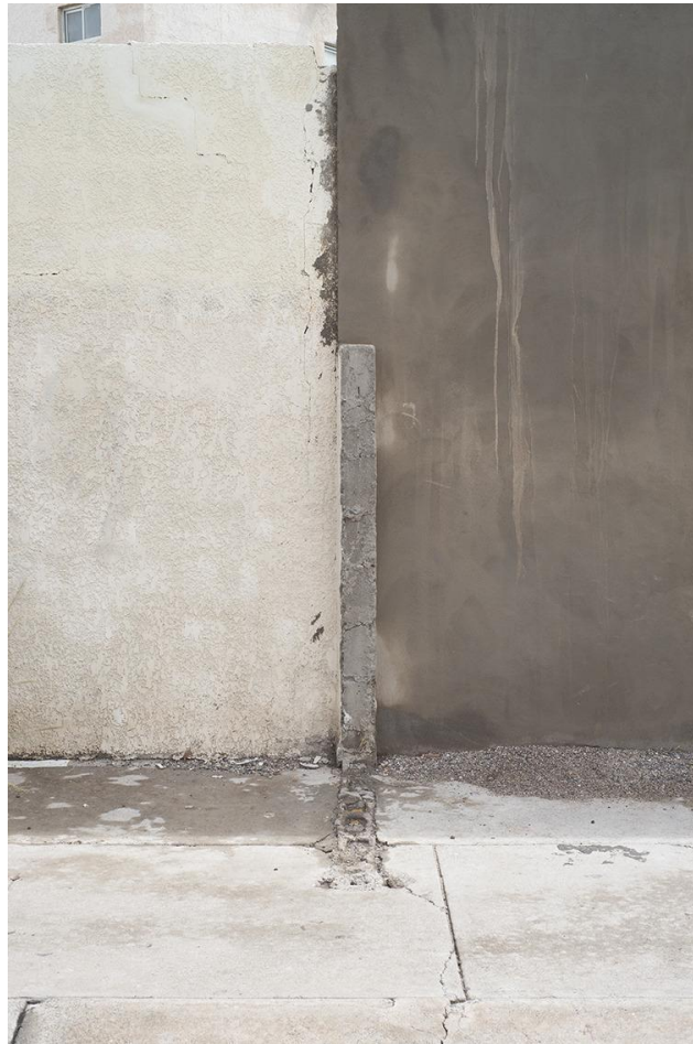
Ilustración 10 Aglae Cortés Zazueta. "(Lo vertical). En el horizonte, el tiempo", 2015. (Políptico de 9 piezas).

(Lo vertical). En el horizonte, el tiempo, 2015. De Aglae Cortés Zazueta.