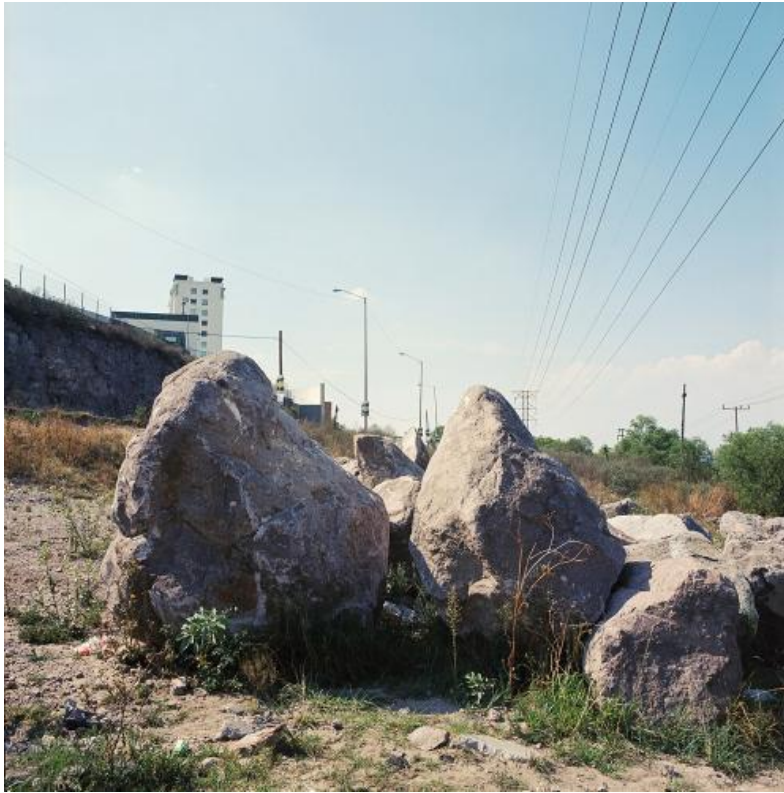
Imagen 2 Saulo Blanco García. "Showroom piedra", 2017.

Este proyecto desarrollado por Saulo Blanco, quien ha desarrollado diversos proyectos abordando lo limitado, la deriva y el fracaso modernista en México, analiza las significaciones personales del Periférico Norte de la Ciudad de México para con el artista. Partiendo de situaciones, circunstancias y escenas que se desenvuelven de manera natural, así como imágenes generadas y orquestadas por Blanco, el proyecto juega con lo real, lo construido y el objeto encontrado. El medio utilizado es la fotografía, pero de muchas formas, ésta se vuelve sólo el soporte para el registro de acciones, ordenamientos y catalogaciones, así como de largos recorridos y derivas por uno de los espacios más insignes del concepto de la periferia, donde es posible encontrar asimilaciones a monolitos, desechos y gestos escultóricos.