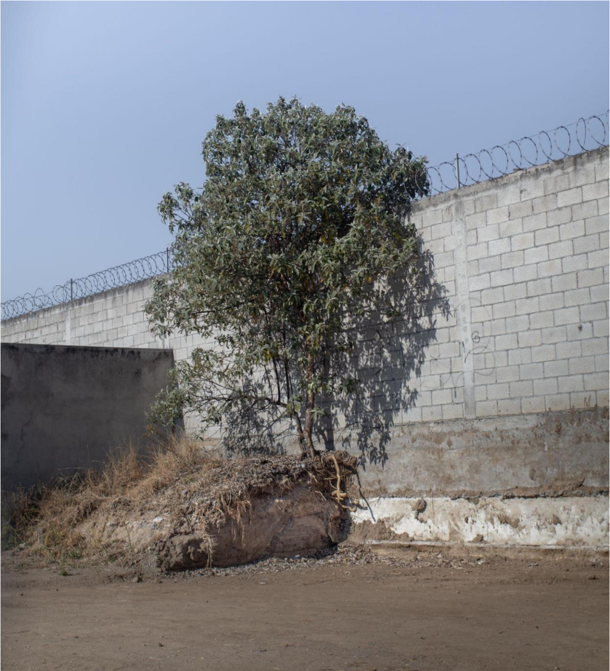
Reducción (inercia del paradigma), 2022. Fotografía digital. Medidas variables.