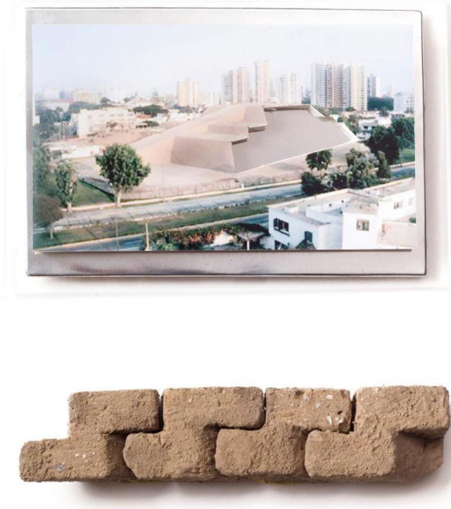
Imagen 3 Augusto Ballaró. "HUACA HUALLAMARCA, 1953 & HOTEL SHERATON", 1983, 2012

En esta pieza, Augusto Ballaró (Lima, Perú. 1986), quien desde lo visual indaga la geometría, color y proporción empleada por las culturas precolombinas y su nexa con la modernidad presente en su país de origen, realiza un montaje que nos acerca a la transformación de un espacio inhabitado dentro en la ciudad en un proyecto arquitectónico de gran escala, que a decir por el título, tiene que ver con la construcción de un hotel Sheraton. Una imagen fotográfica intervenida con aluminio -que asemeja la proyección arquitectónica del proyecto- presenta debajo de ella unos módulos de adobe, aludiendo a esas otras materialidades, arquitecturas y sistemas constructivos empleados antes de la llegada de lo moderno.