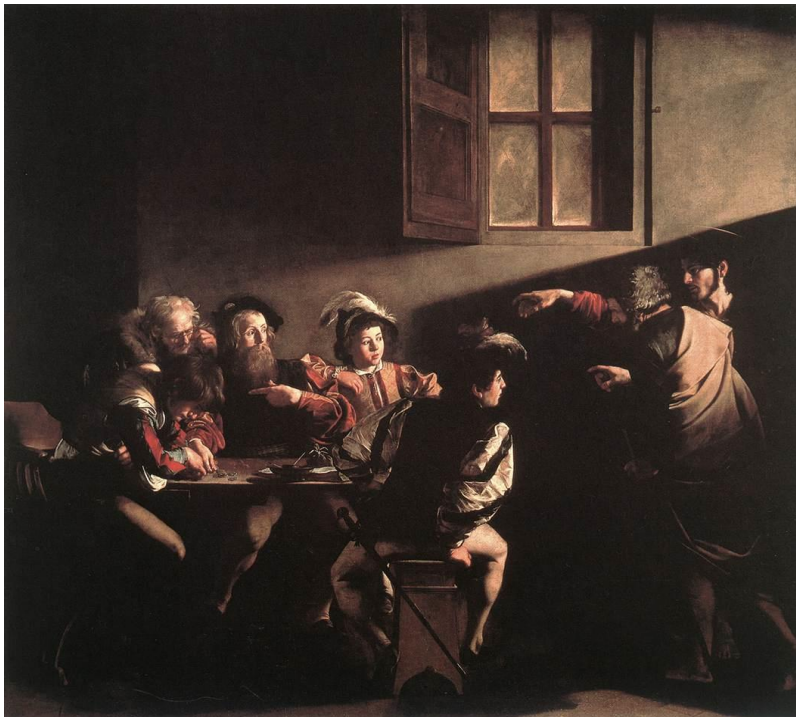
Fig. 5 La vocación de San Mateo , por Merisi Caravaggio

Como en casi todas las pinturas posteriores de Caravaggio, en La vocación la mayor parte de la superficie del cuadro está vacía. Una habitación oscura cuyos muros negros –que debieron ser los de su estudio– apenas se interrumpen en una ventana cuyos vidrios han sido opacados. La única fuente de luz no aparece dentro del cuadro: es una claraboya apenas abierta por arriba de la cabeza de los actores. Pedro y el Mesías, casi en tinieblas, señalan al cobrador de impuestos, que los mira sorprendido en compañía de cuatro compinches vestidos lujosamente y ocupados en contar monedas con una atención pecaminosa. Los trajes de Jesús y su pescador son tradicionales: mantones bíblicos. Los recaudadores de impuestos, en cambio, están sentados y vestidos como se debieron haber vestido y sentado los prestamistas de Giustiniani 5 en la parte baja de su palacio, abierta a los clientes que utilizaban las mesas de cambio. (Enrique 52)