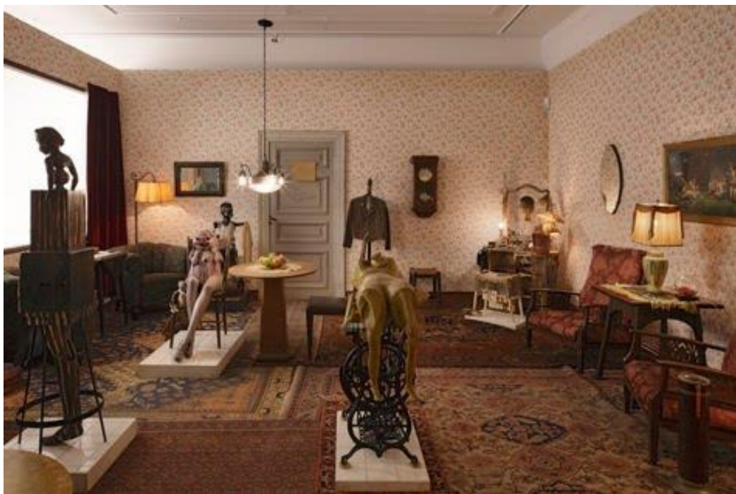
Fig. 2 Roxy's , de Edward Kienholz, 1961

La simultaneidad en lo descrito se complementa con un poco de vivacidad expresiva otorgada por la manera en que el narrador describe la iluminación. Asimismo, la descripción de los objetos hace que la instalación parezca estática, sin dinamismo, puesto que una instalación real siempre es inmóvil, para ser contemplada por los espectadores.