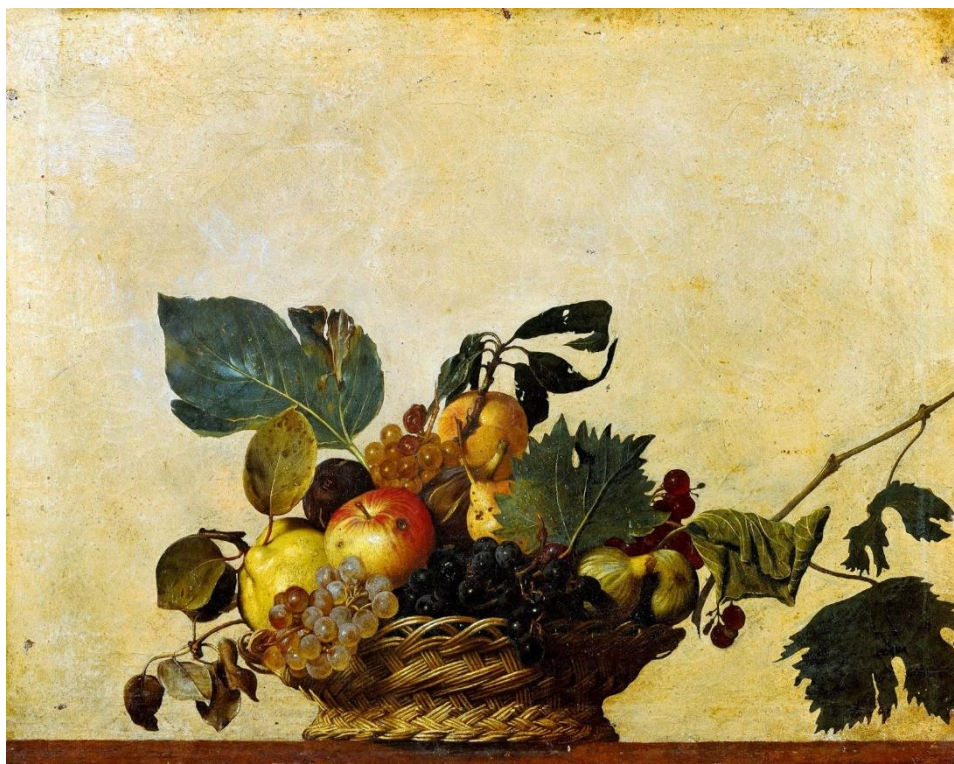
Fig. 3 La canasta de frutas , por Merisi Caravaggio

En lugar de representar una ventana con escorzo hacia el exterior como tendía a hacer el realismo óptico renacentista, ocupaba un espacio tridimensional interior: se veía como si fuera un cesto en una repisa. Para aumentar el efecto, Caravaggio pintó el fondo del cuadro del mismo color que la pared del estudio del cardenal Borromeo en el Palazzo Giustiniani y hasta siguió las pequeñas cuarteaduras y abultamientos de humedad en el muro en que fue colgado. Si no el cuadro completo, al menos su fondo tuvo que ser hecho in situ. Pintar las frutas al borde de la pudrición no le debe haber tomado a Caravaggio más de dos días. (Enrique 19)