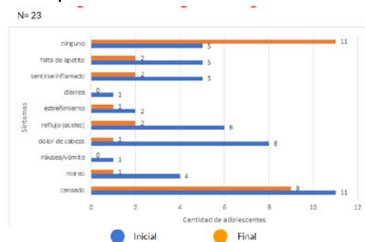
Figura 2. Sintomatología inicial y final de la población

Las frecuencias de consumo alteradas (verduras, frutas, grasa saturada y azúcares) mejoraron.