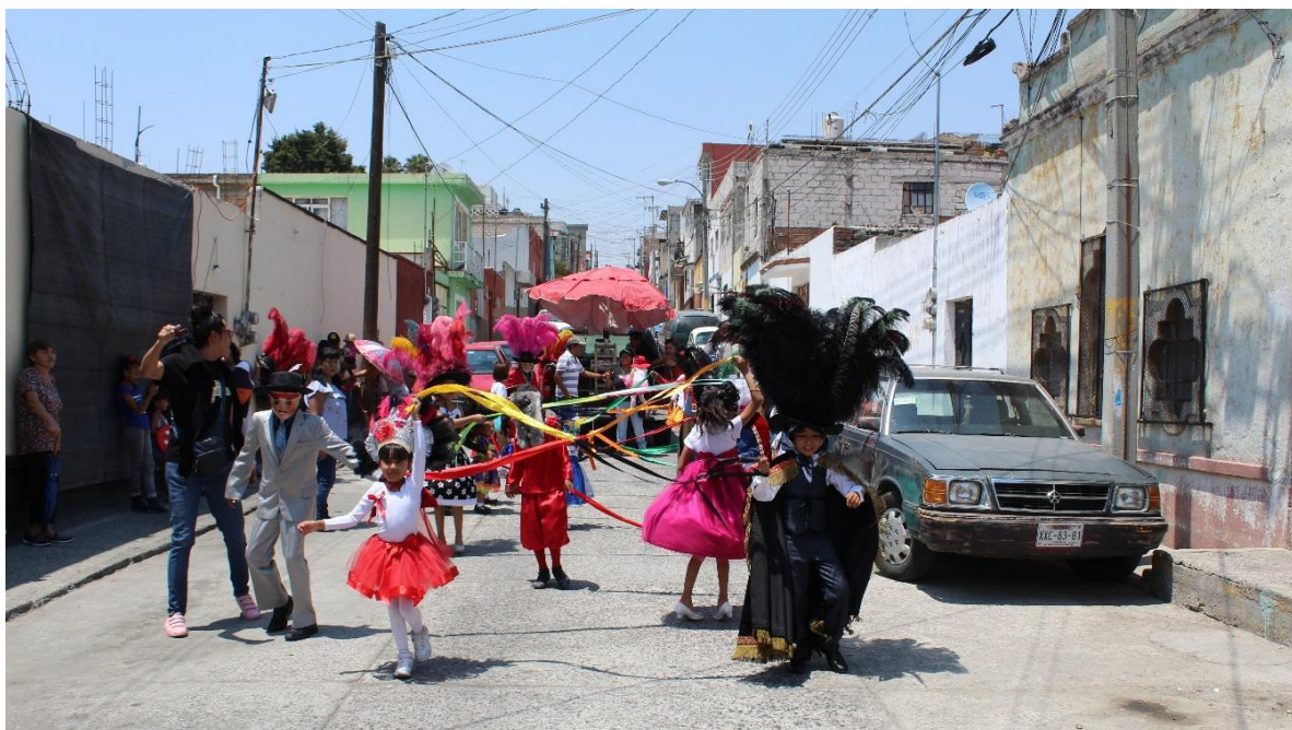
Imagen 10. Baile de los listones. Fotografía tomada durante el trabajo de campo. Xonaca, Puebla, 2019.

La danza de los Huehues se realiza cada año durante el mes de abril. Dentro del barrio hay varias cuadrillas, es decir, grupos de hombres y mujeres que se organizan por calles para hacer sus presentaciones. Cada cuadrilla elige dónde, cuándo y qué música va a bailar, así como el nombre con el que se dará a conocer. Entre las más populares está la cuadrilla de “La Xonaquera” y la cuadrilla de “La 24”.