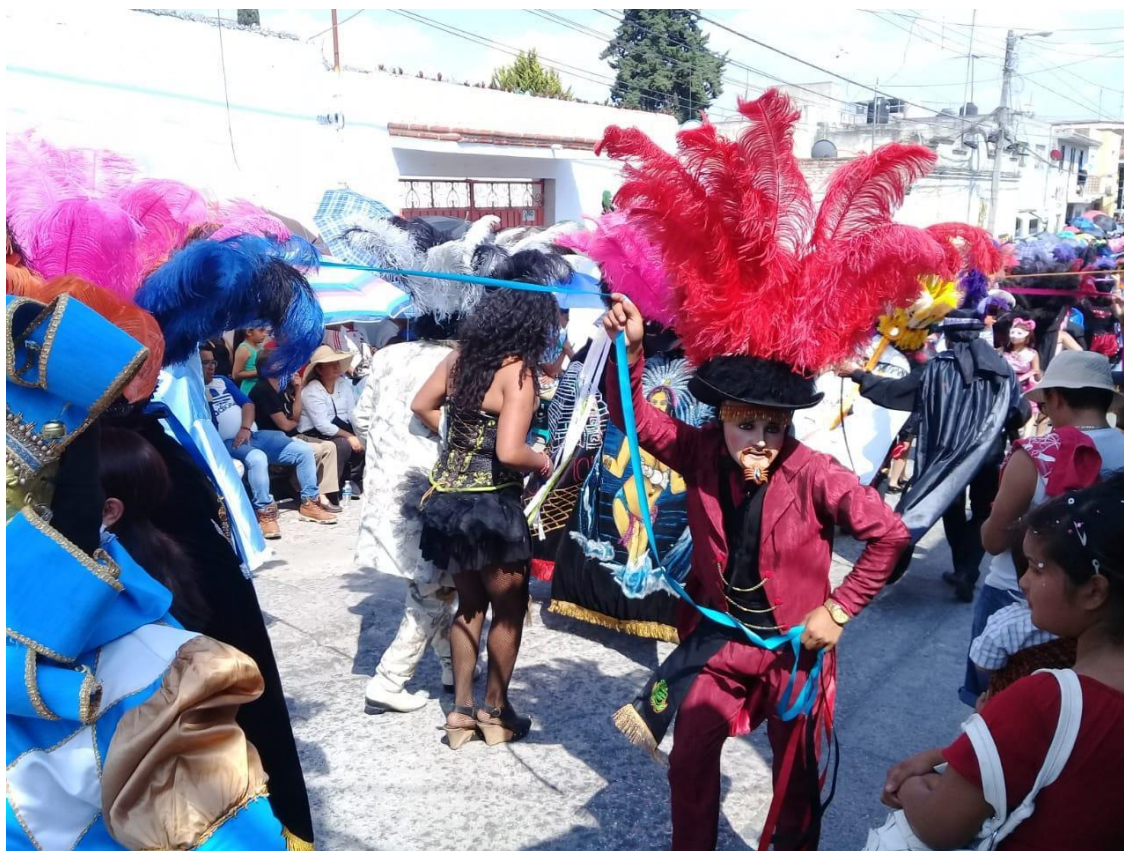
Imagen 12. El día de carnaval. Fotografía tomada durante el trabajo de campo. Xonaca, Puebla, 2019.

En este sentido, el carnaval además de detonar procesos organizativos, incuba la posibilidad de reconfigurar prácticas sociales. Sin embargo, esa misma cualidad transmisora y re-configuradora de prácticas, puede ser cooptada por alguno de los frentes, ya sea del crimen organizado o del Estado, que tienen interés en la zona. Pues justamente narcomenudistas han recurrido a ciertas cuadrillas de Huehues para financiar sus bailes, trajes y grupos sonideros, a cambio de que les sea permitido vender producto en sus presentaciones y que el consumo de estas sustancias sea una dinámica del propio carnaval.