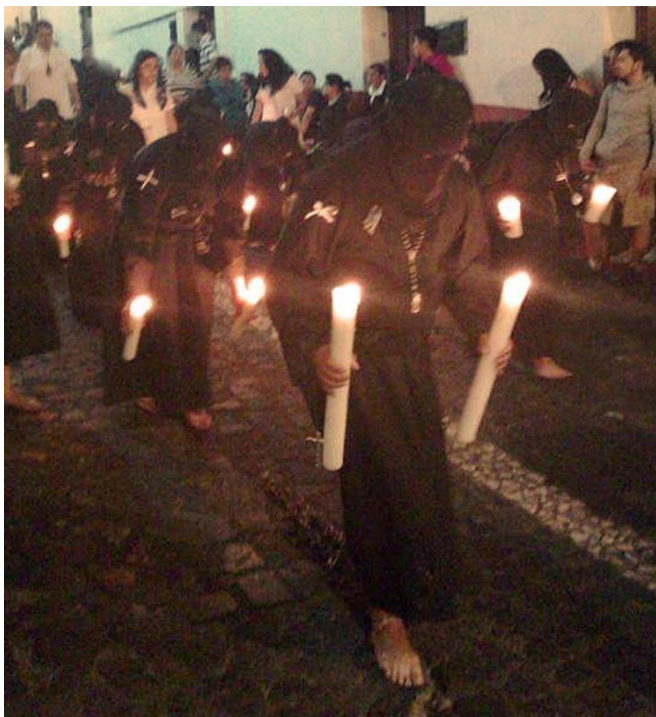
Imagen 1. Ánimas de Taxco, procesión de las ánimas.