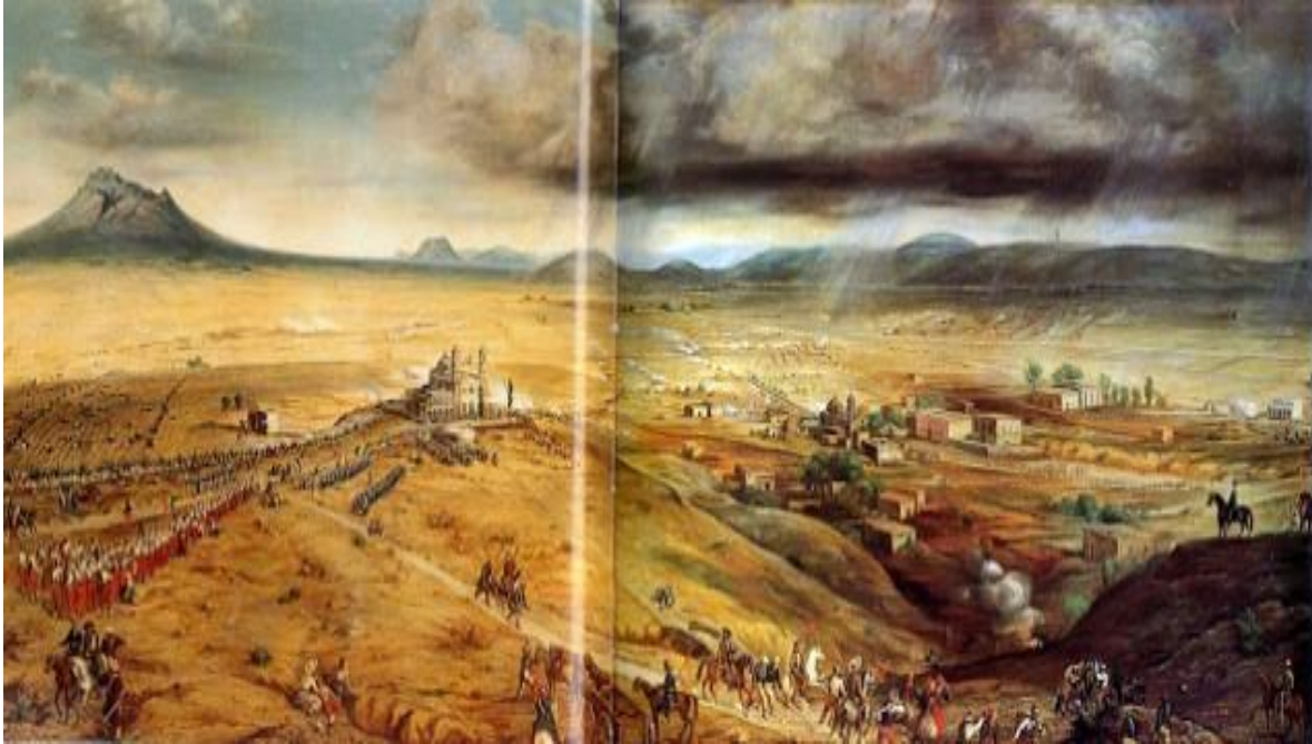
Imagen 6. Xonaca en el tiempo. Xonaca, Puebla, 2019. El cuadro es de autoría del pintor Primitivo Miranda.

de muchas riquezas. Sin embargo, todos estos recursos fueron explotados para la edificación de la Puebla de los españoles en 1531.