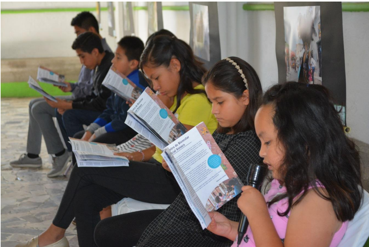
Imagen5. Lectura colectiva. Fotografía recuperada del trabajo de campo. Xonaca, Puebla, 2019.

A través de estas experiencias, me fui dando cuenta de que el barrio no era ese lugar gris que presentaban los medios de comunicación hegemónicos y algunos actores del Estado, sino que en realidad era un lugar que estaba lleno de colores y matices. Tantos como se podían observar en sus paisajes; como el morado, naranja y rojo característicos de los Huehues, el amarillo intenso de la iglesia de la Candelaria o los colores brillantes que se disfrutaban en los murales presentes en muchas de sus calles y callejones. Me di cuenta de que, sin negar la existencia de violencias ejercidas, la estigmatización invisibiliza por un lado las violencias vividas y por el otro omite las bondades y fortalezas del barrio.