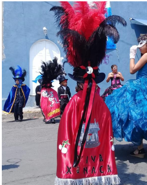
Imagen 8. Huehucitos. Foto tomada durante el trabajo de campo. Xonaca, Puebla, 2018.

[...]Entonces hice una cuadrilla de Huehues en la escuela. También hicieron un museo y yo di exposiciones sobre el barrio. Creo que es importante hacer eso porque mucha gente, con lo que últimamente ha asado, dicen que es lo peor. Lo ponen como un lugar muy peligroso. También hay muchos de aquí que tienen ignorancia del barrio y creen todo lo que dicen, porque no se involucran, pero a mí me gusta ser optimista del barrio. Siento que yo tengo esta forma de ver las cosas por mi familia, que es la que me dice que vea el lado positivo de acá y hay que proteger al barrio, y aquí siento que se protege al barrio.