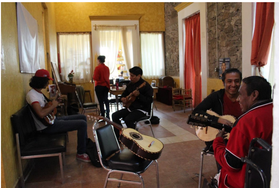
Imagen 15. Ensayo del grupo de música tradicional. Imagen recuperada del trabajo de campo. Xonaca, Puebla, 2019.

Eso es lo que él decía, y se me quedó grabado desde que era estudiante y creo que es eso. Si nosotros ahorita nuestro mundo el que vemos aquí con tanta violencia, con tanto desinterés y con tanta incultura. Entonces si nosotros vemos este mundo, no necesitamos ocultarlo, necesitamos cambiarlo ¿Cómo lo vamos a cambiar? Pues fomentando el gusto por el arte, eso es importante. Y ya entonces vamos cambiando mentalidades y así se va, unos a otros y a otros y a otros. Actualmente tenemos 25 talleres. De artes plásticas, teatro, tejido,