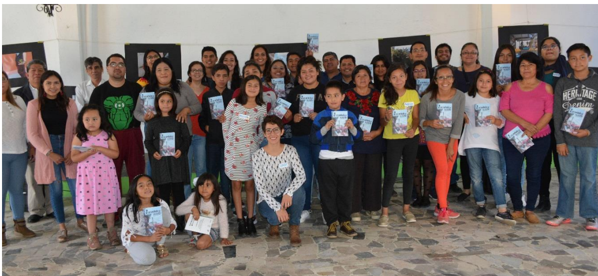
Imagen 4. Presentación Zazamitohac. Recuperada del trabajo de campo. Xonaca, Puebla, 2019.

Por otro lado, el proyecto de Zazamitohac siguió avanzando. Cada semana a lo largo de un año y medio, nos hemos reunido constantemente con las niñas y niños para trabajar la revista. A los seis meses de facilitar talleres de foto, redacción y periodismo, hicimos la presentación del primer número. La invitación se extendió a todas y todos los vecinos del barrio y al público en general. Los contenidos seleccionados para ese número estuvieron relacionados a los diversos esfuerzos colectivos del barrio para ofrecer desde diversas trincheras, espacios para la cultura, el arte y la educación. Por lo tanto, se realizaron reportajes sobre el Centro de Bienestar Social, la mesa directiva y el carnaval de los Huehues. Además, se llevó a cabo una exposición fotográfica, con el material realizado durante esos meses de trabajo. Asimismo, se realizó una lectura colectiva de los textos y una reflexión en torno al barrio, las niñas y los niños y los futuros planes posibles del proyecto.