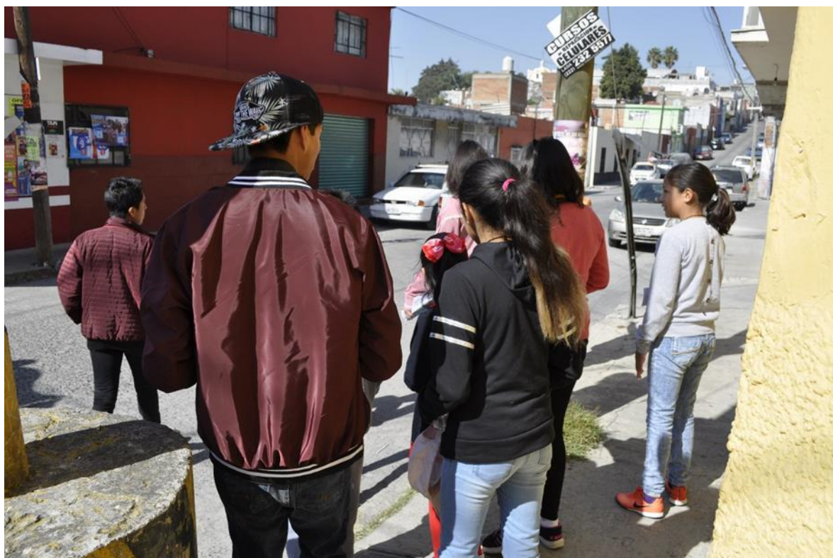
Imagen 9. Caminado el barrio. Fotografía tomada durante el trabajo de campo. Xonaca, Puebla, 2019.

Cada uno dio su punto de vista. Algunos niños motivados por los argumentos de sus compañeras, externaron en que para ellos no representaba mayor conflicto que se escribiera “las niñas y niños”, incluso uno dijo que si fuera al revés, es decir, si se escribiera solamente “las niñas”, él no se sentiría incluido. Por lo tanto, lo justo era escribir “niñas y niños. Una de las niñas, dijo que su maestra le explicó que cuando escribes “los niños” ya están incluidas las niñas. Al final, acordaron que cada quién escribiría como se sintieran más cómodas, pero que lo hicieran de una forma u otra, el mensaje iba dirigido tanto a niñas como a niños.