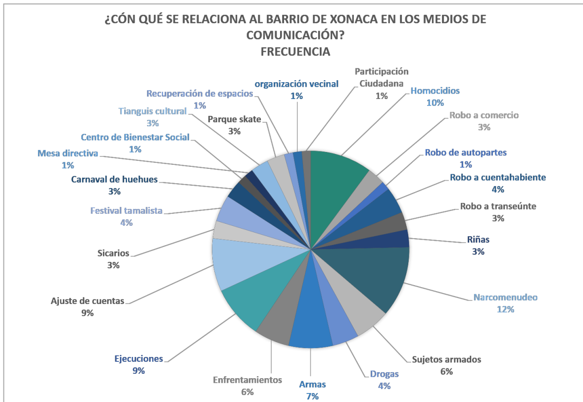
Tabla 8. Frecuencia de temas con los que se relaciona al barrio. Elaboración propia.

¿Cómo se adhieren esos imaginarios a los territorios y a los sujetos que los habitan? En un ejercicio que incluyó a 5 mujeres y 5 hombres de entre 21 y 40 años de edad, en torno a la pregunta ¿Cuáles consideras que son los lugares más inseguros de la ciudad de Puebla? Los resultados fueron: La María, La Calera, El barrio de Xonaca, Agua Santa, el centro, Cruz del Sur, La Margarita y Bosques de San Sebastián. Al preguntarles si alguna vez habían ido al barrio de Xonaca o sabían dónde estaba, sólo una mujer respondió haberlo visitado en algún momento de su vida. Al preguntarles por qué lo consideraban peligroso, las respuestas versaban entre “por lo que dicen que pasa ahí”, “por las noticias”, “porque me dijeron que ahí era peligroso” y “dicen que ahí matan”. Ninguno había tenido alguna experiencia directa de violencia o delincuencia con el barrio.