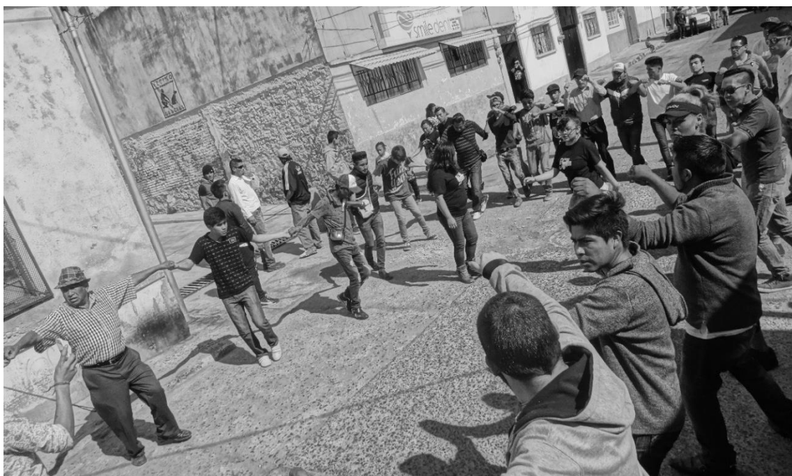
Imagen 11. Ensayo de baile de la primavera. Xonaca, Puebla, 2017.

Una cuadrilla, la que más influencia tiene sobre el resto de las cuadrillas, decidió que quería cambiar esa dinámica que promovía la violencia y el acoso hacia las mujeres. Se dieron cuenta de que los más pequeños, imitaban sus acciones en los bailes de las cuadrillas de niñas y niños. Por lo tanto, resolvieron que ya no se le daría ese trato a la mujer en su danza, los hombres sólo bailarían alrededor de ella sin hacer ningún tipo de agresión. Al poco tiempo, el resto de las cuadrillas replicaron la propuesta.