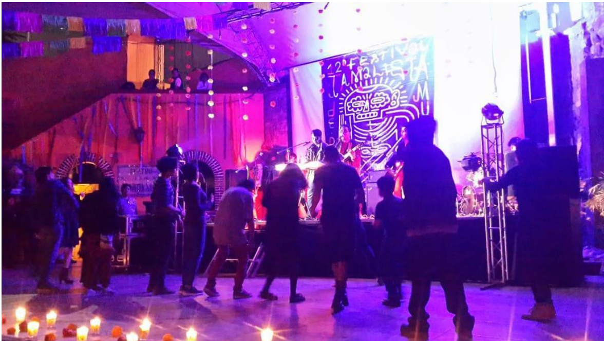
Imagen 1. La fiesta Tamalista. Niños, niñas, jóvenes y adultos bailando juntos. Fotografía recuperada del trabajo de campo. Barrio del Alto, Puebla, 2018.