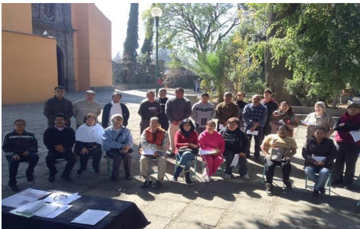
Imagen 14. Reunión vecinal. Xonaca, Puebla, 2017.

Dentro de las cosas que buscábamos era hacer una casa de cultura, ya lo logramos. La otra cosa que queríamos hacer en los lavaderos era una galería de arte, de arte de aquí del barrio, también ver lo de la seguridad y otras cosas. Entonces ahí lo propuse, me pidieron que armara el proyecto más en forma y lo redacté. Y ya pues empezamos a trabajar, nos metimos, nos empezamos a meter, así a barrera, levantar un poco y ya después hacíamos las reuniones