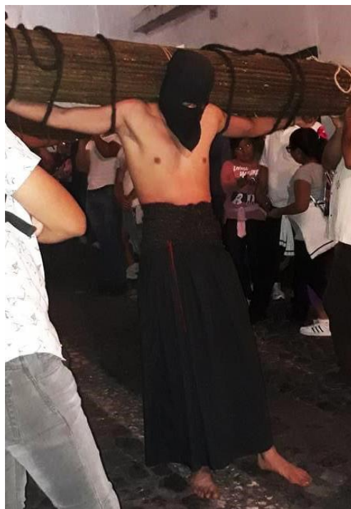
Imagen 2. Encruzado de Taxco Guerrero.

Con estos y otros atractivos, Taxco se colocó como uno de los destinos predilectos para los turistas y, eventualmente, fue colocado dentro de la denominación de “Pueblo Mágico 2 ”, con todo lo que esto implica. La oferta hotelera y restaurantera tuvo que ampliarse. Hoteles y restaurantes empezaron a brotar como alpiste en tierra húmeda. Eventualmente llegaron los Oxxo, un bodega Aurrera y un Chedraui, convirtiéndose rápidamente en la fuente principal de empleo para los más jóvenes, sobre todo para los que su nivel de estudios se quedó en secundaria o prepa.