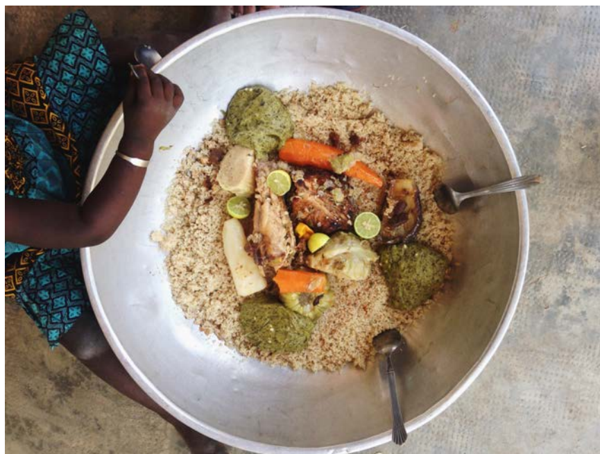
Imagen 11. Ceebu jen que Cocinamos el Último día en Kalamissoo

espiral sin fin, sin un inicio (aunque trate de buscarle un inicio al camino de la descolonialidad). Transitar acá es transitar la vida, la vida sin fracturas donde un día estoy escribiendo esta tesis, y otro día viajo en espíritu a Usuy. Además de hacer esta investigación para hablar de lo que hablo, la hice para encontrar mi raíz, de donde vengo yo, mis abuelas y abuelos y mis primeros rezos.