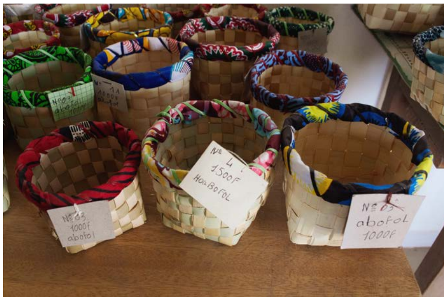
Imagen 6. Canasto para Rituales del Fetiche

Esta experiencia de conocer otros objetos posibles, y verse explorando otras maneras de tejer, pareciese que les dijera a ellas mismas que pueden hacer cosas diferentes a las que les enseñaron en un inicio las monjas. Por ejemplo, las mujeres tienen en su bodega rollos de hilo de plástico que les llevaron extranjeros muchos años atrás, y últimamente decidieron hacer uso de este para los canastos que se usan en las ceremonias con el fetiche.