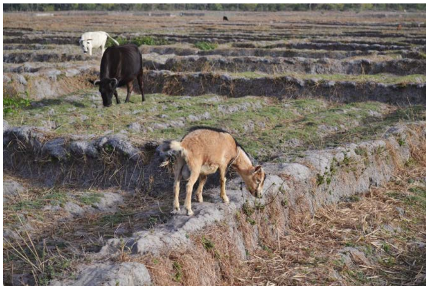
Imagen 1. Cultivo de Arrozales en Verano.