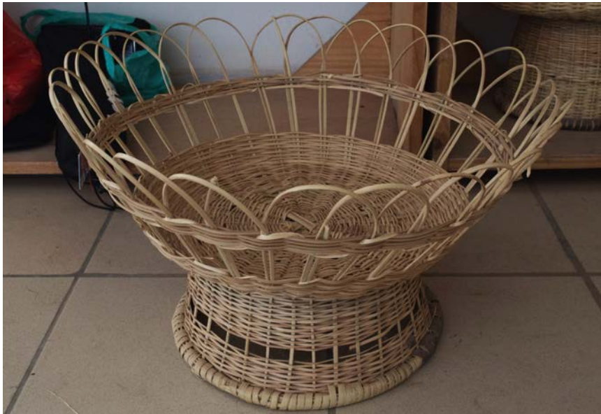
Imagen 7. Canasto Diseñado por Pablo