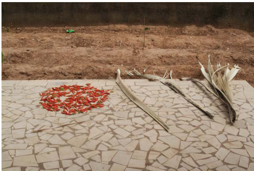
Imagen 10. La Cosecha de Aji y la Palma de Rônier Secándose