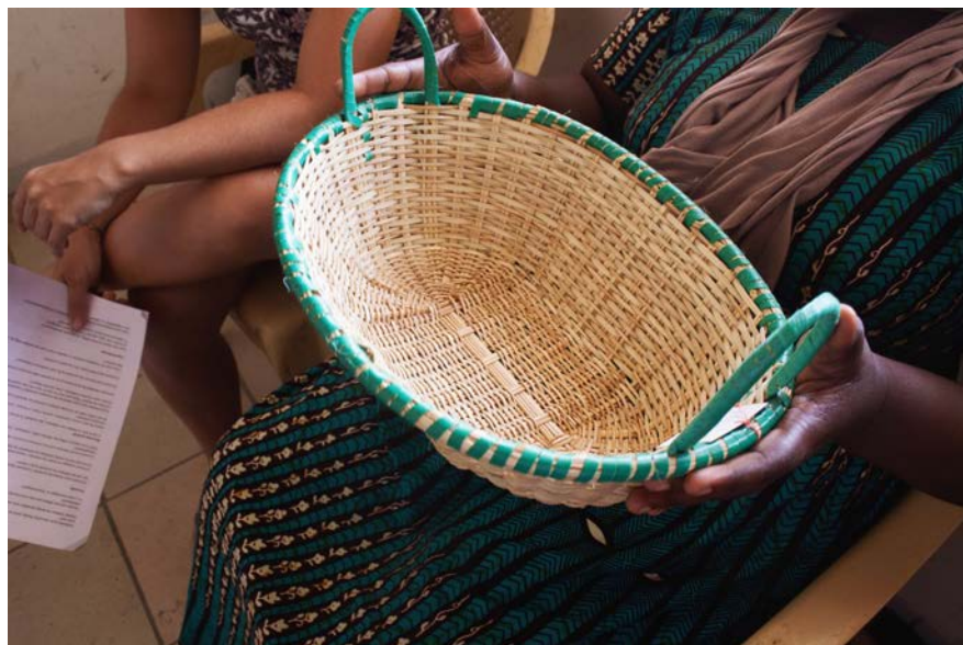
Imagen 5. Canasto de Elisabeth con Tejido de Casamance