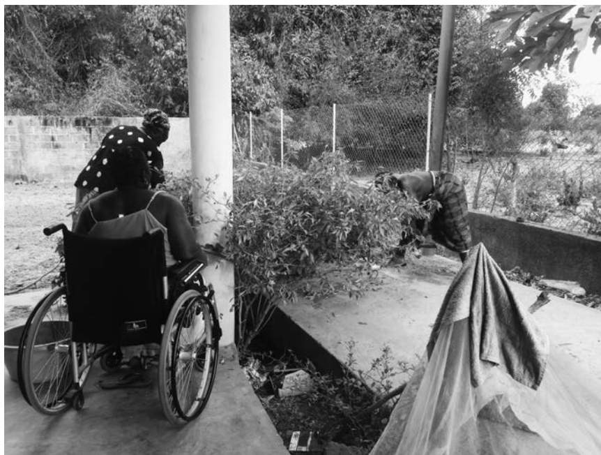
Imagen 3. Mujeres de Kalamissoo Cosechando Aji