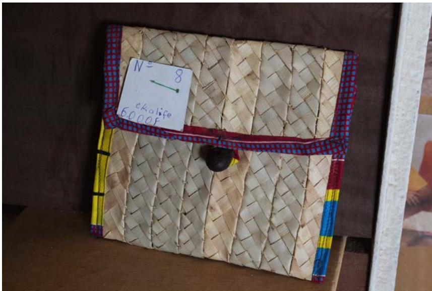
Imagen 8. Bolso Diseñado por Ángela