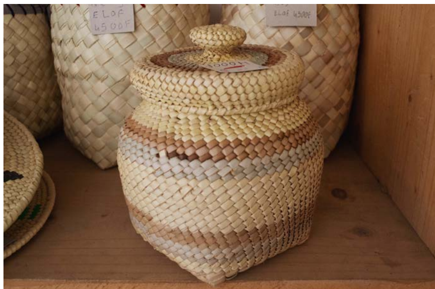
Imagen 4. Objeto Usado para Guardar Alimentos en los Matrimonios. Tejido Típico de las Mujeres de Kalamisoo