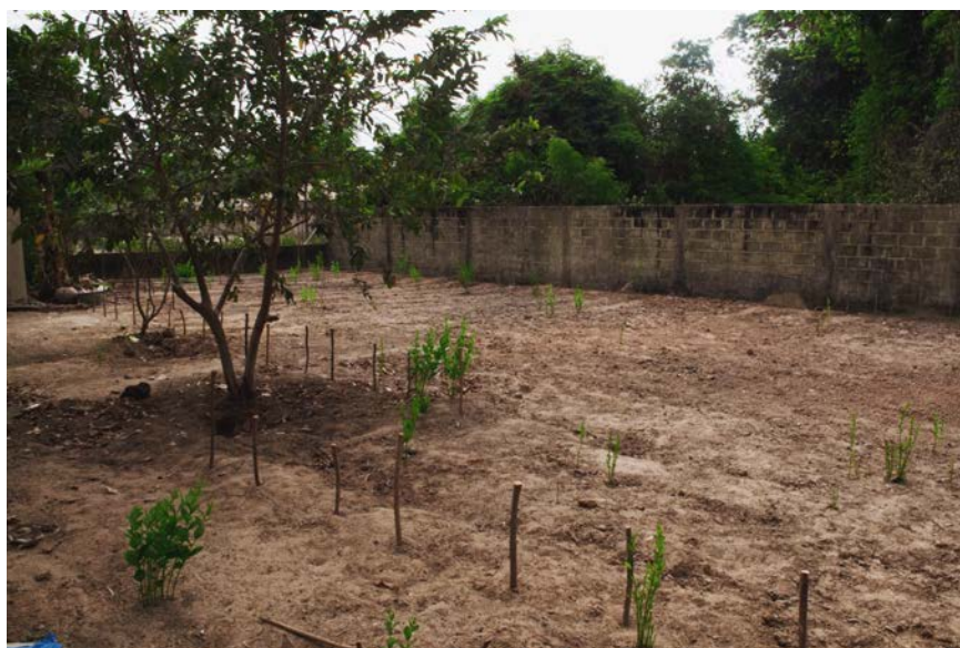
Imagen 2. Jardín Trasero del Centro de Artesanas Kalamissoo

se encuentra el otro, donde trabajan las cuatro mujeres. Al lado de él hay otros dos salones: en uno guardan materiales que les han regalado, y en el otro, guardan la palma dividida; cada una tiene un espacio. En el fondo del taller se encuentra el salón grande, en donde trabajan la mayor parte de las mujeres, y allí también están las máquinas de coser para los martes. Atrás, hay dos cocinas: una que les construyeron inicialmente cuando se creó el Centro y otra que construyó Dexde a petición de las mujeres, para que cocinaran y comieran en sus largas jornadas, de la cual hacen poco uso. Al fondo hay un gran jardín que actualmente las mujeres autoconvocadas empezaron a sembrar hace poco. Entre ellas cultivan, cosechan, cuidan y organizan.