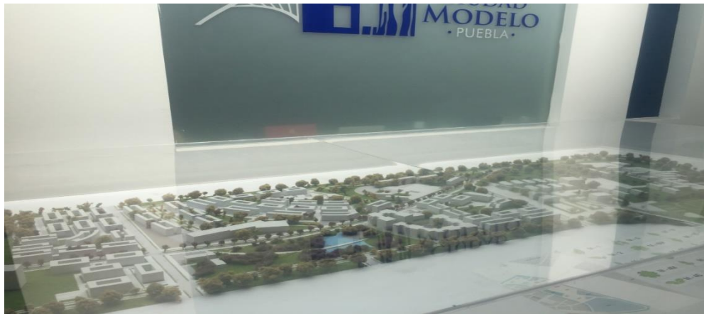
Figura 9. Maqueta Ciudad Modelo