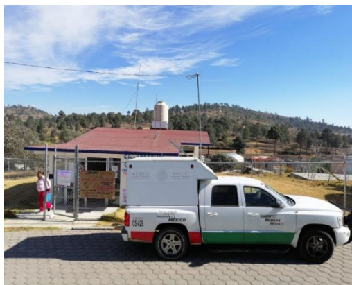
Figura 4 Caravana de salud