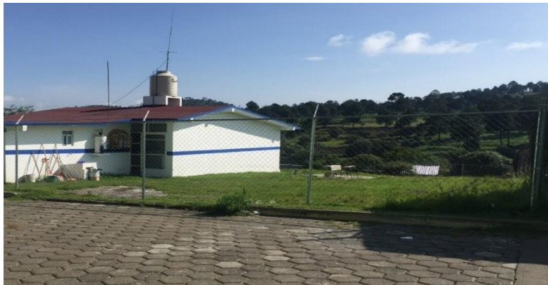
Figura 7. Lateral, casa de salud