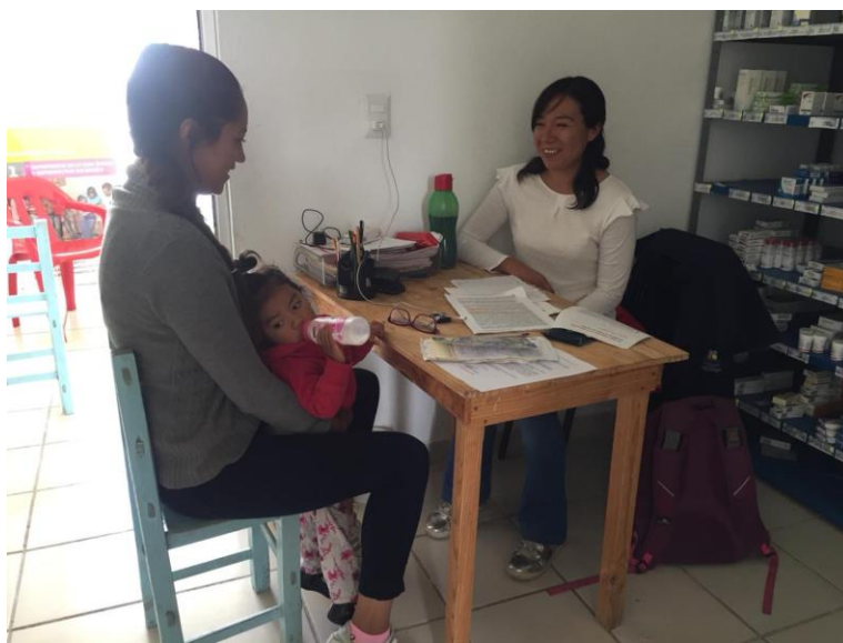
Figura 6. Cuarto de medicamentos