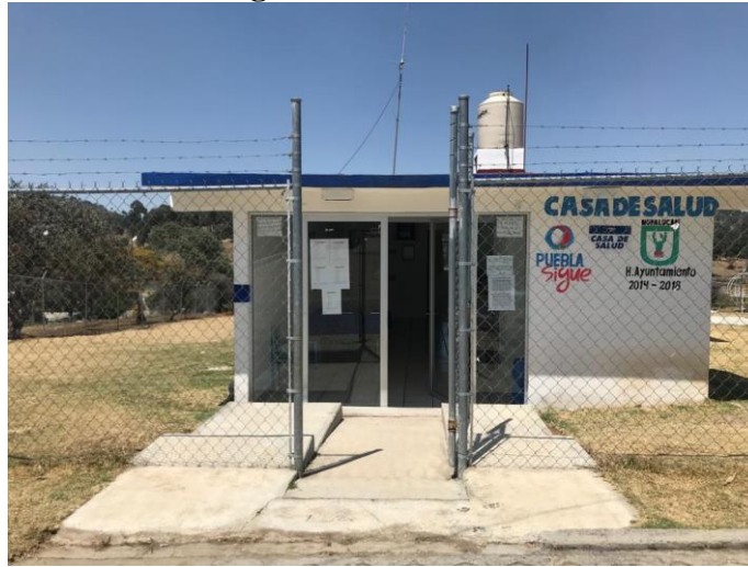
Figura 8. Casa de salud, frente