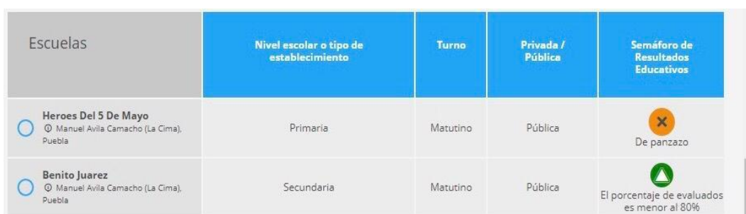
Figura 11. Resultados prueba ENLACE

En el año 2017, los estudiantes de la primaria de la comunidad tuvieron un resultado igual al “de panzazo” (ver figura 11). A diferencia de este resultado, la secundaria obtuvo el indicador de “excelente”, aunque el porcentaje de los estudiantes evaluados es menor al 80% del total.