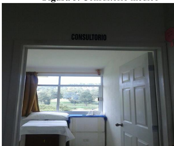
Figura 5. Consultorio médico