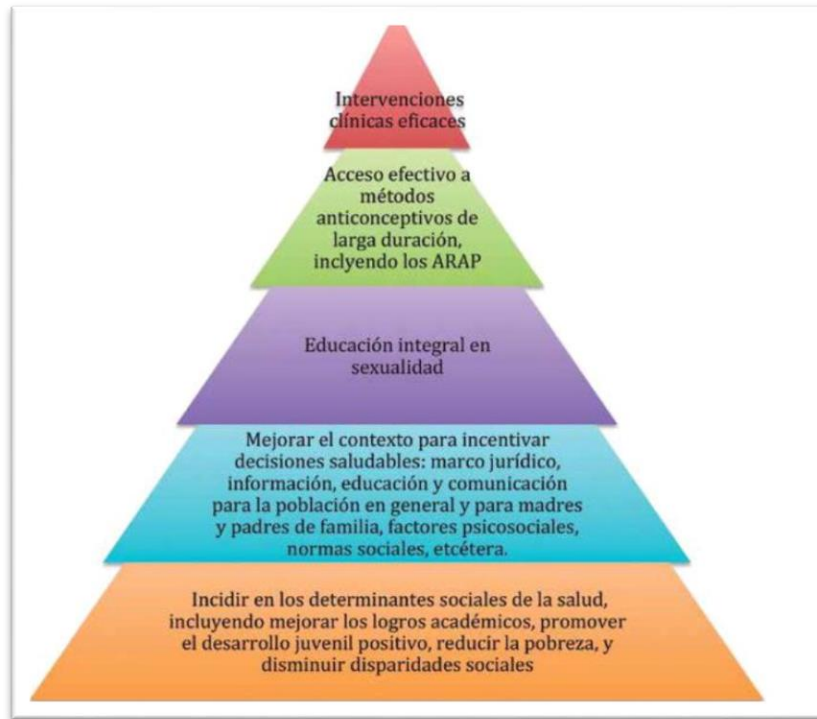
Figura 10. Pirámide ENAPEA marco conceptual