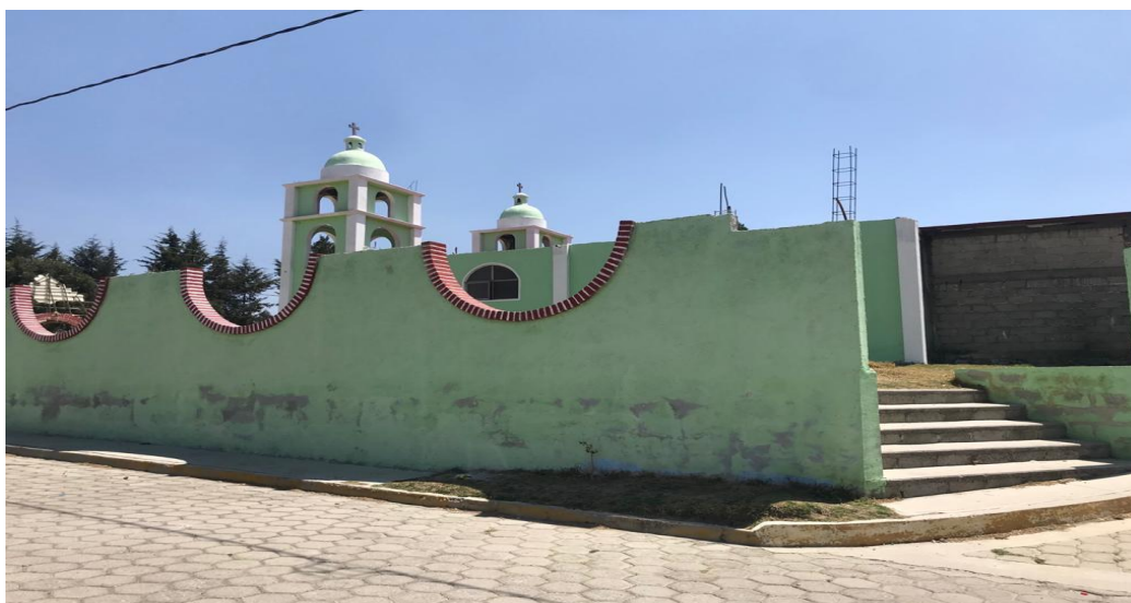
Figura 3. Iglesia del Corpus Christi, Manuel Ávila Camacho