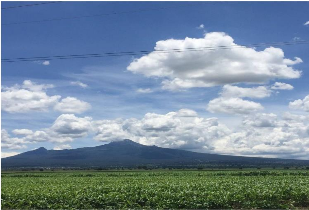
Figura 1. La Cima

Fuente: Archivo personal, fotografía del camino a la comunidad, tomada el 22 de junio del 2018.