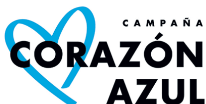
Imagen 1: Campaña Corazón

La colaboración entre agentes y actores políticos propios de la región donde se desarrolla el problema son de suma importancia para la creación de un nuevo imaginario, donde los crímenes expuestos se vean por lo que son y no como un mal necesario imposible de erradicar. Como se ha expuesto previamente, la concientización de la población es indispensable para cambiar la percepción social de fenómenos como la prostitución, la trata y el turismo sexual. No por ser un tema educativo debe contenerse a este ámbito, la mayoría de las víctimas de trata y de potenciales delincuentes, son precisamente ciudadanos que no tuvieron posibilidad de concluir sus estudios, siendo un poco irrelevante concentrar esfuerzos en las escuelas. Con esta idea en mente es que se han creado campañas de difusión de información, como Corazón Azul.