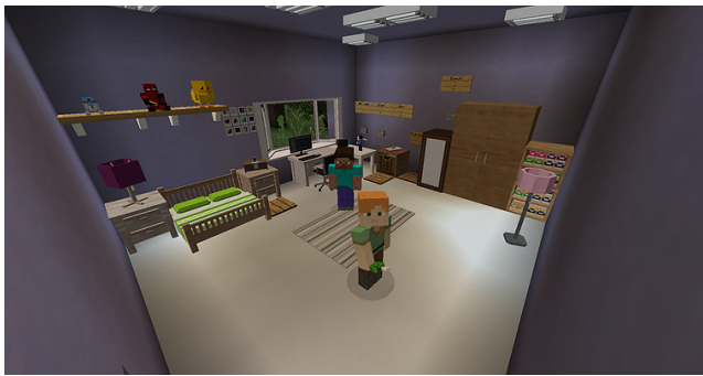
Figura 5. Prototipo de baja fidelidad

Los resultados arrojaron que a los usuarios les gustó el diseño de la habitación y les recordaba a sus propias habitaciones, se sentían escuchados en actividades como el diario y el chat. Debido a que Minecraft tiene limitaciones con las interacciones, tuvieron problemas con la identificación de emociones al igual que con las actividades con las que no podían interactuar directamente y sólo salían mensajes. Se sentían cómodos en la interfaz, sin embargo el cómo se contabilizaban los puntos de los medidores de calma, estrés, motivación y energía les causaban estrés.