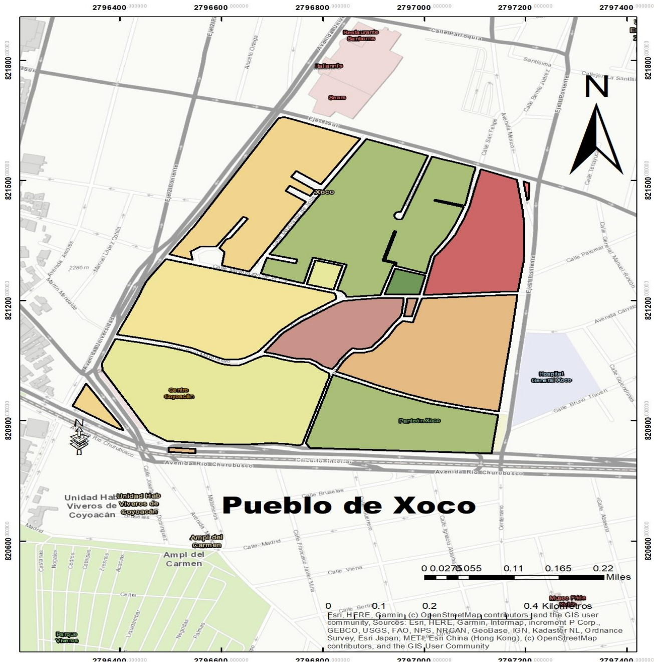
Mapa 1. Pueblo de Xoco.

Eje 1 poniente (Av. Cuauhtémoc) y al sur con Av Churubusco. De acuerdo con información de INEGI (2010) se encuentra formado por 9 manzanas con un total de 568 m 2 .