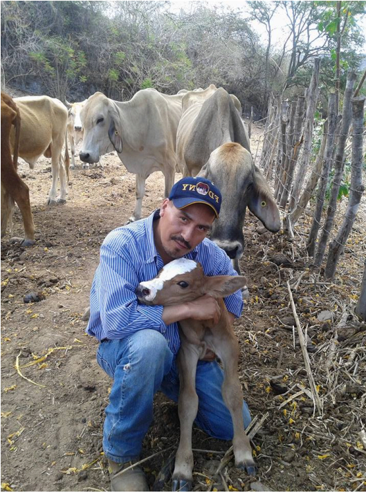
Imagen 14. Bonifacio.

Como lo expliqué en el capítulo II, Zhou, et al (2008) y Stephan (2011) explican que una persona con nostalgia, se aferra al pasado, y a lo ausente, sin embargo también se puede observar que la nostalgia coloca a una persona en el presente en relación a su comunidad de origen.