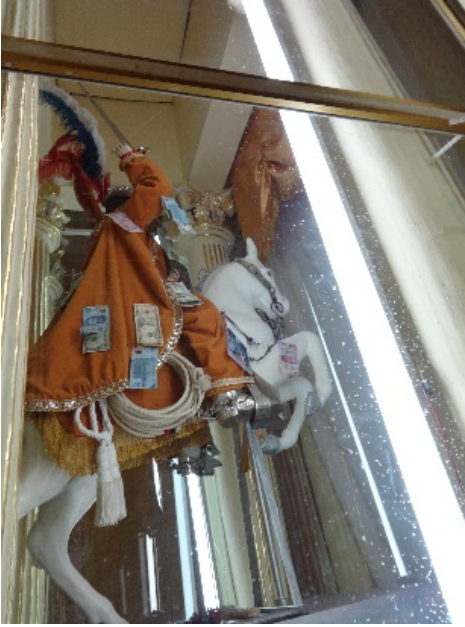
Imagen 6. Santiago Apóstol. Fuente: Hernández Soto 2014

En el camino que transcurrió desde enero del 2014 a noviembre del 2015 me encontré que la comunidad de Chila de la Sal, tanto en Puebla como en Nueva York, quería contar sus historias, crear conversaciones de lo que han vivido a través de la mirada de quienes han emigrado, mostrar su cotidianidad, sus costumbres y tradiciones. La investigación cambió de rumbo y me centré en lo que la comunidad tanto de Puebla como en Nueva York quería, no solo desde el aspecto religioso, sino de su cotidianidad, de su familiaridad y de sus recuerdos más significativos, así como de sus planes a futuro más importantes.