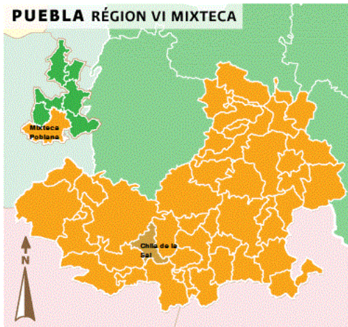
Figura 2. Chila de la Sal, Fuente: Inafed, 2013

De acuerdo con datos estadísticos del INEGI (Instituto Nacional de Estadística y Geografía) en el año 2000 la población de Chila de la Sal era de 1,961 habitantes y en 2010 la población había disminuido a 1,237 habitantes debido a la migración internacional e intermunicipal dando como resultado que la mayor parte de la gente en Chila son personas de la tercera y cuarta edad 10 .