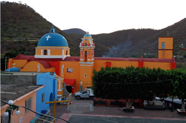
Imagen 1. Iglesia de Chila de la Sal. Hernández Soto, 2014.

julio de 1887 que tuvo Chila de la Sal en contra de Tulcingo del Valle. Santiago Apóstol participó con siete combatientes chileños para derrotar a los tulcinguenses que querían separarse de las tierras chileñas, (entre Chila de la Sal y Tulcingo del Valle, existen 10 kilómetros de distancia). Es por ello que los chileños aseguran que el día más fuerte de la batalla salió Santiago Apóstol protegiendo al pueblo y combatiendo con su espada. Cuando los tulcinguenses pidieron ayuda al Arcángel Gabriel Apóstol, cuenta la leyenda que Santiago y dicho Arcángel, hablaron y se reconciliaron. Días después mediante los tribunales del estado, a cada uno de los municipios les fue concedido su escrituración legal.