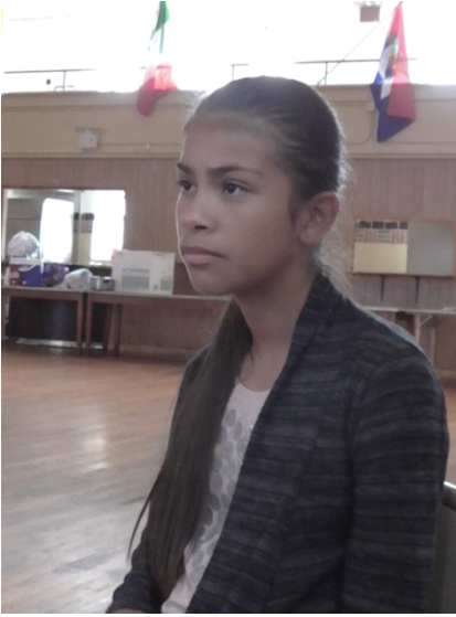
Imagen 15. Dalia.