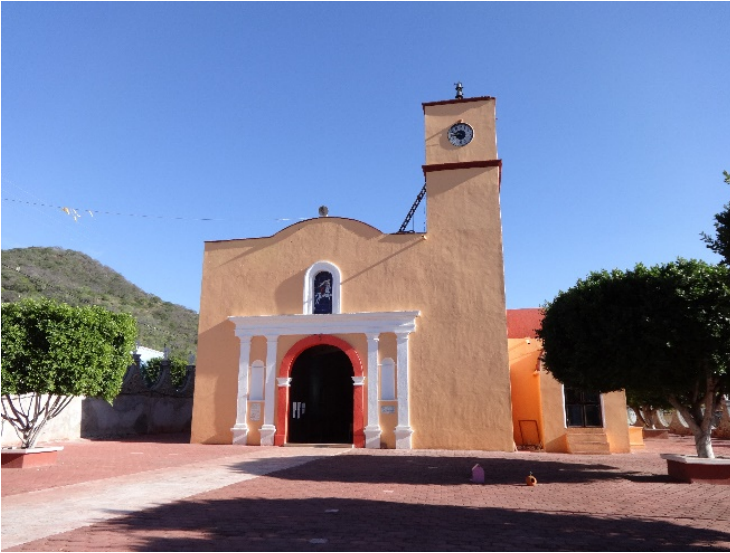
Imagen 5. Iglesia de Chila de la Sal.

En los siguientes tres meses (de mayo a julio del 2014) me dediqué a realizar una investigación exploratoria. Continué visitando Chila de la Sal, para encontrar elementos que sustentaran el supuesto de que las prácticas religiosas vinculaban esta comunidad transnacional (comunidad de origen y comunidad de destino) y a partir de este vínculo recreaban formas de identidad. Lo que buscaba era propiciar a través del video participativo que la comunidad transnacional de Chila de la Sal (Chila y Nueva York) generara un debate y reconociera las formas de construcción de sus nuevas identidades, en consecuencia con la migración. Consideraba que era un proyecto que haría expresar las historias, los deseos y la visión de la realidad de los migrantes, con el objetivo de reconocer formas de construcción de la identidad.