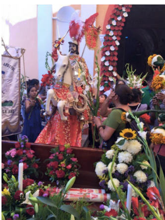
Imagen 2. Santiago Apóstol, santo de Chila de la Sal en la fiesta de mayo. Hernández Soto 2015

Las vestimentas del santo provienen de las compras que han hecho los migrantes en Nueva York. El santo está envuelto en billetes de diez hasta 100 dólares, dinero prensado en sus vestidos por migrantes que regresan a Chila de la Sal quienes lo ofrecen como símbolo de agradecimiento o en su caso, lo colocan familiares que reciben remesas para pedirle al santo por el bienestar de los que se encuentran en el país fronterizo. Personas muy mayores de Chila de la Sal me comentaron que esta tradición tendrá unos veinte años, desde que la mayoría de las personas emigran a Estados Unidos, pues anteriormente no se llevaba a cabo.