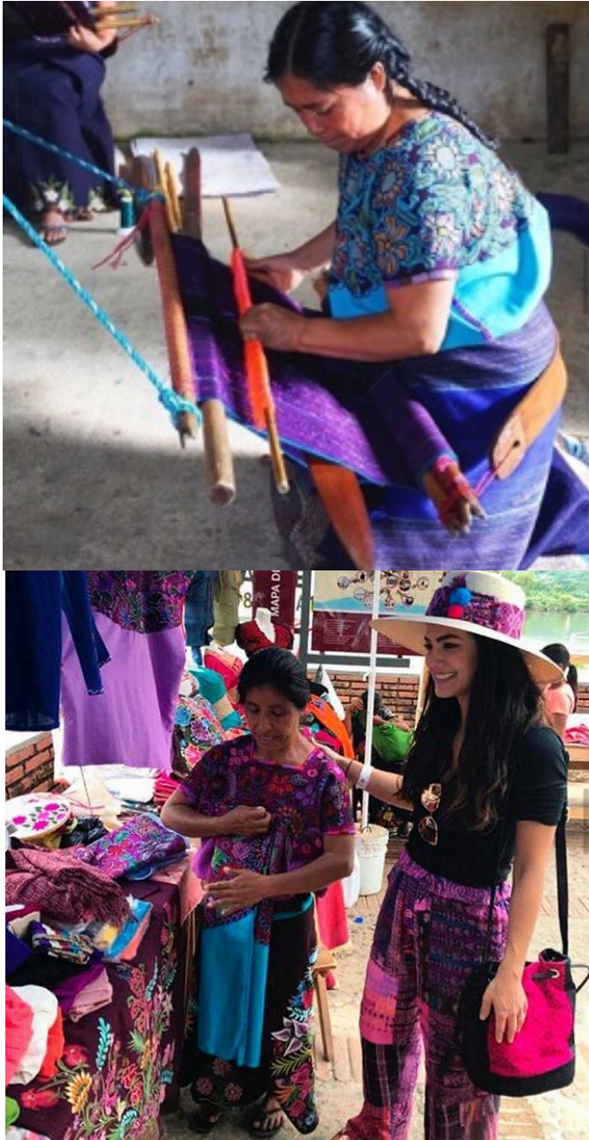
Imagen 7 Fotografía en Redes Sociales.

Por otra parte, el hecho de que se encuentren vestidas con una vestimenta propia de la comunidad permite entender que, si lo que porta la mujer protagonista es lo llamado contemporáneo, por contraposición lo que visten las demás mujeres es el pasado, el atraso.