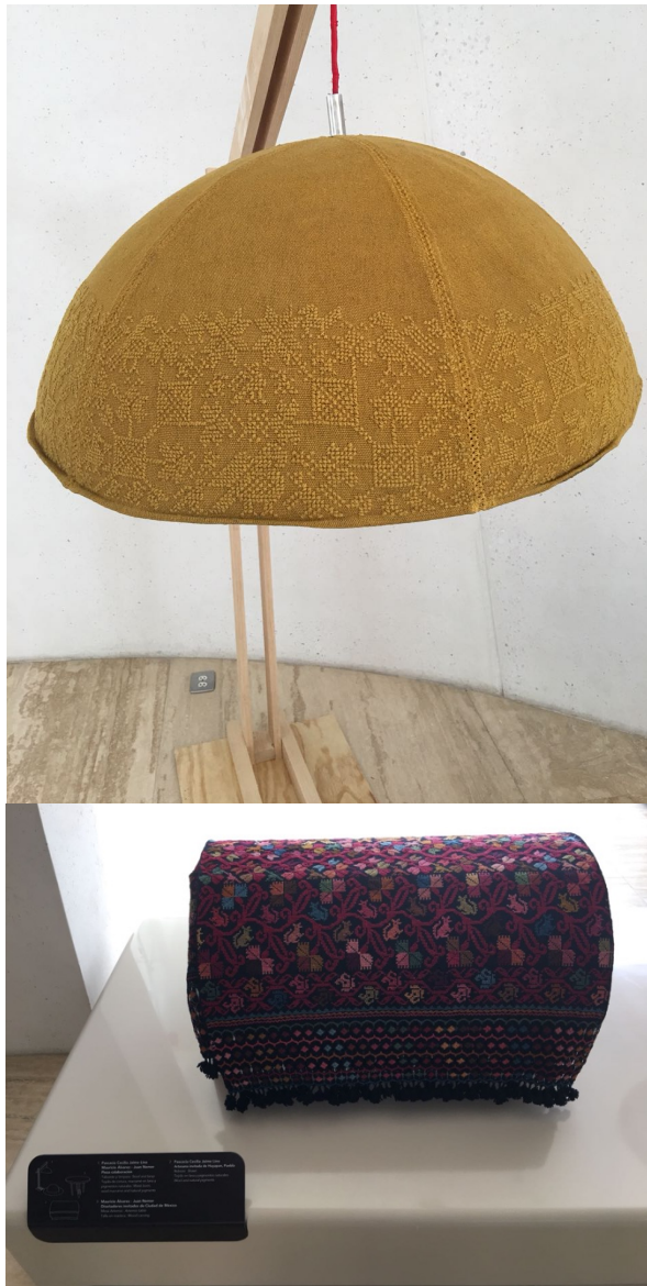
Imagen 3 Exposición Visión y Tradición. Objeto superior: colaboración diseñador - artesano. Objeto inferior: artesano.

Tal como se cubrieron con cal para blanquear las pirámides, los textiles de los pueblos indígenas sufren un blanqueamiento y los íconos una descontaminación que les permita volverse atractivos. O bien, en caso de dejarlos intactos, se combinan con prendas de origen occidental que les den un contrapeso que aliviar su aspecto. El hecho es tratar de que se vea que uno está a favor del pasado glorioso indígena, que ya se ha transformado y avanzado hacia el progreso, la limpieza. Con este proceso, las imágenes y los objetos que continuaban teniendo la unión de la palabra – imagen, es destruido, su acto comunicativo, es reemplazado por un objetivo mercantil.