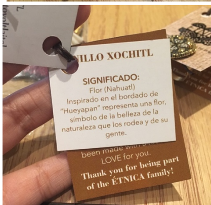
Imagen 4 Marca étnica. Etiquetas.

Si en las entrevistas los diseñadores aseguran que las personas indígenas no son el centro de venta de sus marcas, sólo parte de ellas, parte integral, pero que al final del día fungen más como proveedores que como creadores, la publicidad que crean los desmiente. Las imagen de las personas indígenas sigue teniendo la misma atracción que despertó en el siglo XX. El impacto fácil de lograr, el camino fácil para ablandar el corazón de sus compradores.