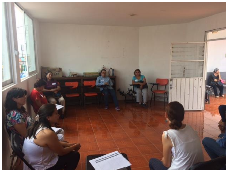
Fotografía 1. Reunión en el CMJ con madres de familia colonia La Libertad. (García,2017)

También se buscó el apoyo del área cultural de la Universidad Iberoamericana la cual gestionó la aprobación de un presupuesto destinado a eventos culturales financiados por la misma Universidad para llevar nueve eventos culturales a colonias pobres del municipio de Puebla. Se buscó nuevamente el apoyo de la iglesia para que más personas tuvieran conocimiento del proyecto, así también se crearon las primeras estrategias para crear vínculos entre las empresas de la zona.