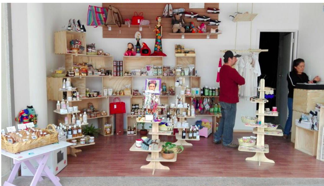
Fotografía 7. Punto de venta en el centro comercial Triángulo las Animas. (García,2017)

Aunque esta intervención concluyó sin lograr el objetivo de implementar circuitos de Economía Social queda una valiosa experiencia de fomento para la creación de capital social a través de la cultura y el arte que puede detonar procesos de Economía Social para el beneficio de las comunidades.