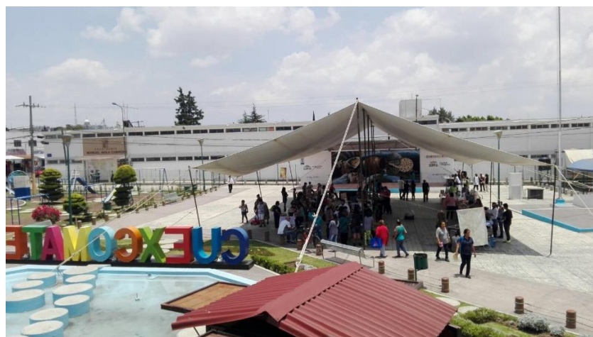
Fotografía 3. Feria de Economía Social y Disco Sopa en la colonia La Libertad. (García,2017)