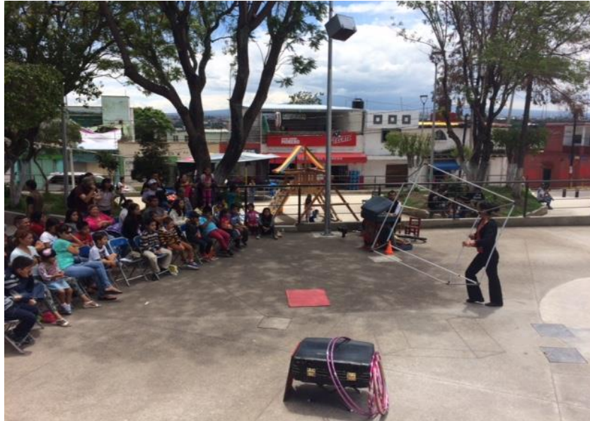
Fotografía 5. Presentación de circo explainada de colonia Romero Vargas. (García,2017)