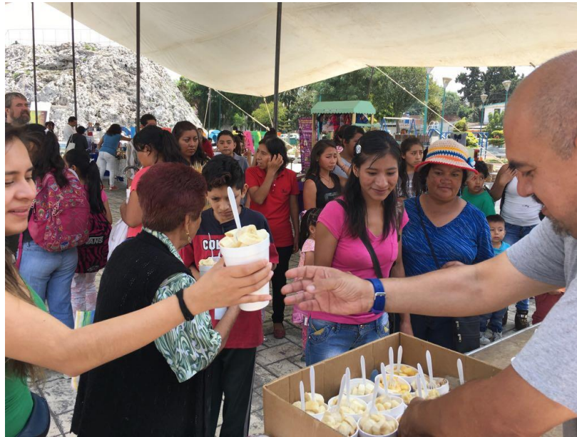
Fotografía 2. Feria de economía social y disco sopa colonia La Libertad. (García,2017)

en el caso de las empresas de las zonas Centro y San Baltazar, lo cual fue muy significativo pues uno de los grandes retos del proyecto era lograr la autogestión de los grupos.