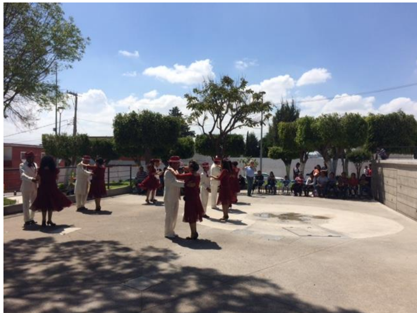
Fotografía 6. Presentación de danzón explainada de colonia Romero Vargas. (García,2017)