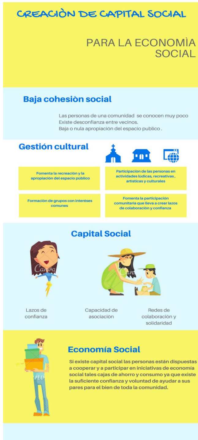
Infografía1 .Proceso de creación de capital social a través de la gestión cultural (Elaboración propia ,2018)