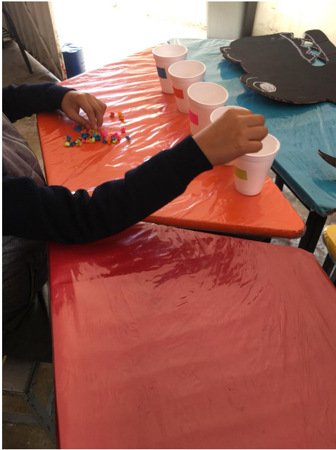
Actividades de motricidad fina