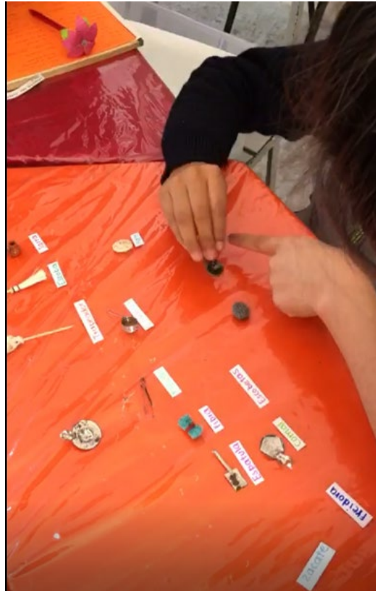
Identificación de utensilios del hogar