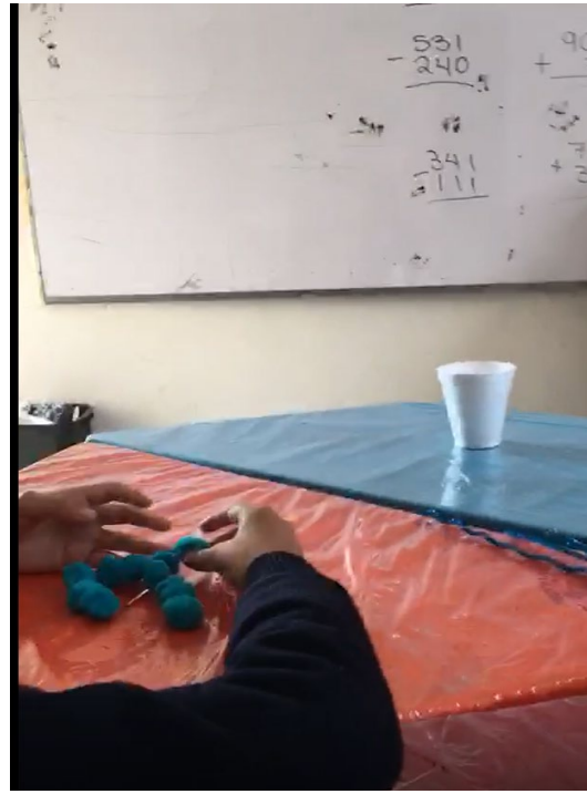
Atínale al vaso