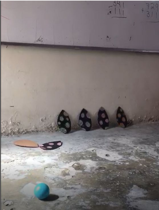
Identificar el color del huevo