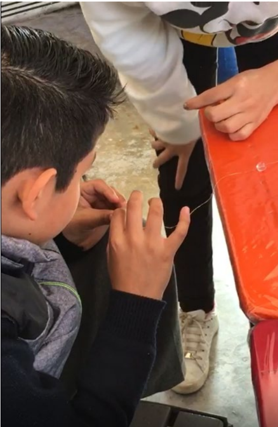
Insertar cuentas de madera