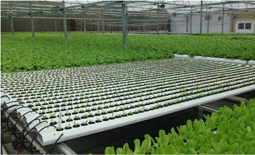
Ilustración 1. Agriculturers. (2015). Aprende sobre el sistema hidroponía NFT