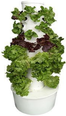
Ilustración 3. Hydro Environment. (2017). ¿Qué es el sistema NFT?