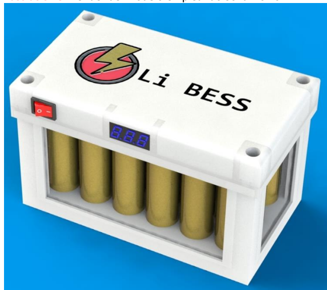
Ilustración 3: Render del modelo empleando SolidWorks.

De igual forma los resultados que arrojó nuestra investigación documental concuerdan en que no existe actualmente en el mercado un dispositivo enfocado en el segmento de los usuarios finales de sistemas de energías alternas, así mismo la única información y documentación encontrada al respecto corresponde a proyectos de aficionados o hobbistas que carecen del rigor y seriedad propio de un ingeniero o una investigación científica.