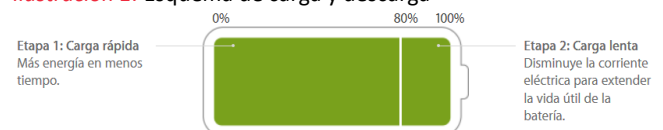
Ilustración 1: Esquema de carga y descarga

En comparación con las baterías tradicionales, las baterías de iones de litio se cargan más rápido, duran más y tienen una densidad de potencia más alta, lo que hace que la batería sea más ligera y tenga una mayor duración.