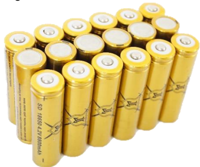
Imagen 1: Fotografía de las baterías

En la tercera etapa pasamos al análisis y diseño, se seleccionó una batería de ácido que se quería sustituir, se buscó la forma de sustituir sus especificaciones técnicas (voltaje y carga); posteriormente se diseñó el circuito eléctrico de las baterías. Durante la cuarta etapa, se contemplaron los cálculos anteriores, para diseñar lo que pasaría a ser el gabinete o soporte donde se harían las conexiones de las baterías, se diseñaron modelos 3D de las piezas de este ocupando SolidWorks como software de modelado; se decidió además añadir un voltímetro para monitorear el estado de la batería en todo momento.