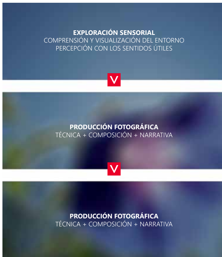
Figura 1. Fases del proceso de creación visual desde la percepción invidente (elaboración propia, 2015).

A partir de esta experiencia, tomando como referencia el trabajo fotográfico realizado en el taller se han distinguido tres fases (figura 1) que representan los pasos más significativos que abarca el proceso de creación fotográfica de personas invidentes: