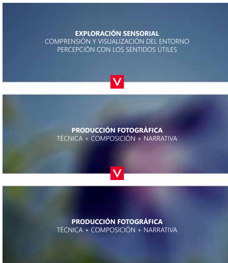
Figura 1. Fases del proceso de creación visual desde la percepción invidente (elaboración propia, 2015).

A partir de esta experiencia, tomando como referencia el trabajo fotográfico realizado en el taller se han distinguido tres fases (figura 1) que representan los pasos más significativos que abarca el proceso de creación fotográfica de personas invidentes: