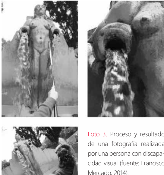
Foto 3. Proceso y resultado de una fotografía realizada por una persona con discapacidad visual.