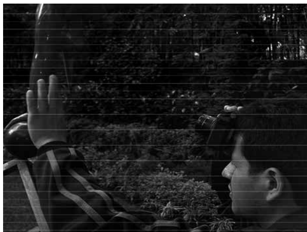
Foto 2. Fotografía que demuestra la práctica fotográfica de fotografía sensorial.