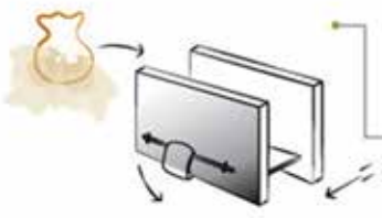
• Una vez envuelta la masa en la tela se coloca entre las placas de la prensa.