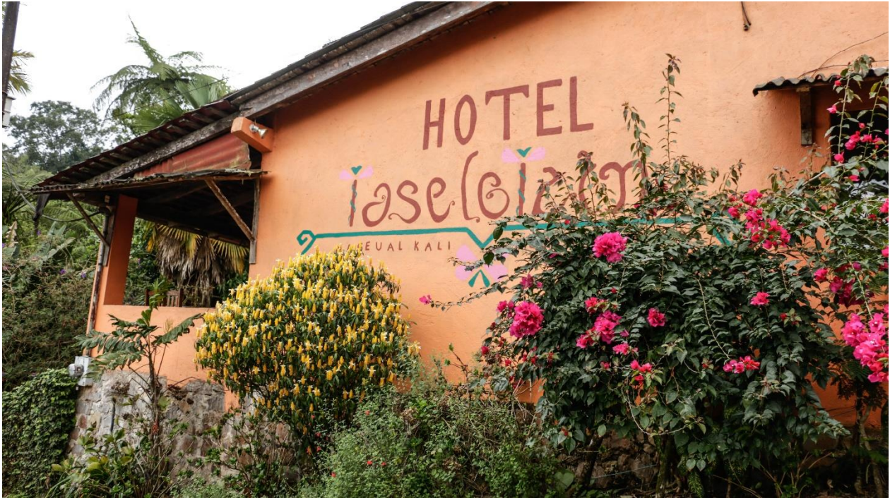
Imagen 6. Fotografías del Hotel Taselotzin