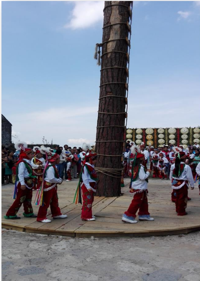
realizada el 4 de octubre de 2015, en la explanada de la iglesia de San Francisco de Asís.