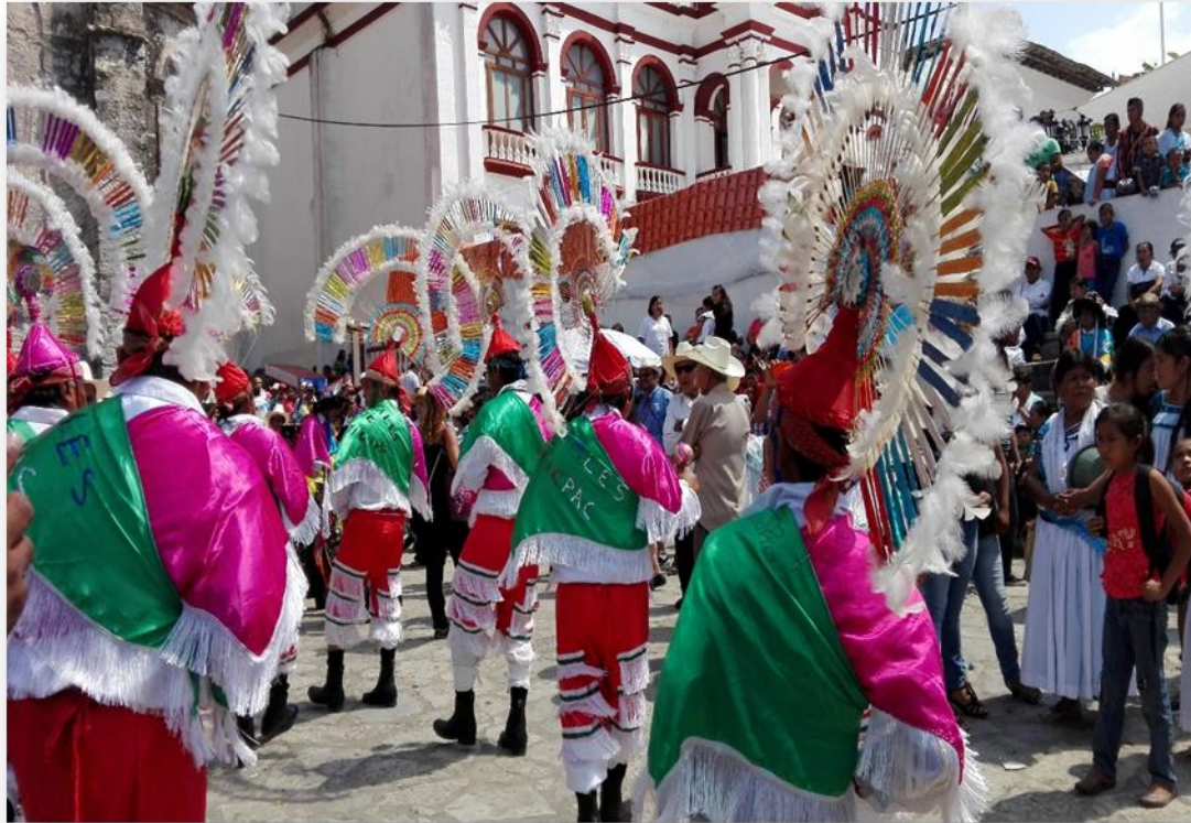
Imagen 4. Danza de los Quetzales o Cuetzalines

Foto: Paz Cuahutle Gaytán, realizada el 4 de octubre de 2015, en la explanada de la iglesia de San Francisco de Asís.