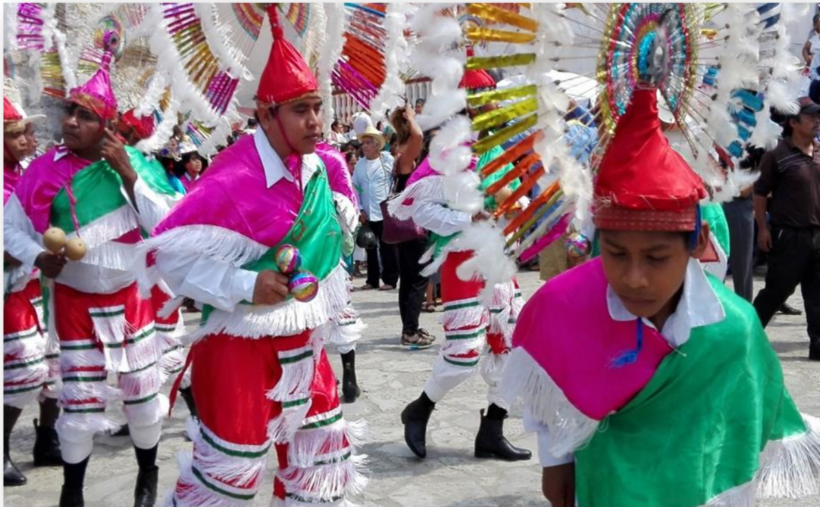
Imagen 3. Danza de los Quetzales o Cuetzalines, fiesta del 4 de octubre, celebración al Santo Patrono San Francisco de