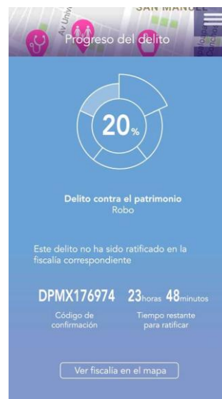
Pantalla de proceso de denuncia de prototipo de alta fidelidad

Este prototipo se hizo utilizando la herramienta JustInMind Prototyper, que proporciona herramientas para que el usuario