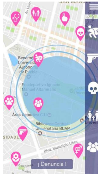
Pantalla de página principal de prototipo de alta fidelidad