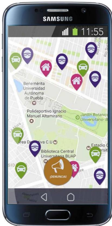
Pantalla de página principal de prototipo de fidelidad media

En esta versión, el usuario comprendió cómo iniciar el proceso de denuncia, sin embargo, no lo entendió como un proceso que va más allá de presionar el botón para denunciar. Logró conocer que existía la posibilidad de interactuar con otros, pero el resto de los objetivos no se cumplieron por tres factores importantes. El primero fue el estilo visual, que no era armónico y se sentía pesado. El segundo estuvo logado a cuestiones semióticas, porque los íconos no representaban lo que se pretendía para el usuario. El tercero fue la arquitectura de información, que no estaba estructurada para que los usuarios entendieran las tareas como procesos.