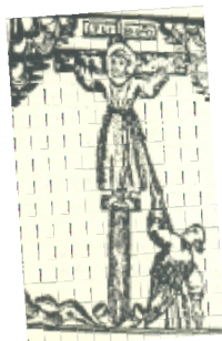
San Felipe de Jesús, 1632

hay una dicotomía cuando no verdadera contradicción entre lo que la estampa religiosa popular muestra y lo que la Iglesia propone en estos últimos años, en especial en América Latina. La incapacidad por crear una iconografía propia, acorde con los tiempos pero que contenga la rica tradición iconográfica y emocional del cristianismo, es un síntoma interesante que estudiado con cuidado podría aportar datos útiles para entender los fenómenos religiosos actuales y para medir el peso de la Iglesia en los circuitos de comunicación contemporáneos.