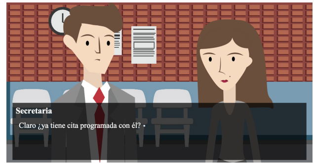
Figura 4: Pantalla de prototipo de media fidelidad.

Buscamos que se viera estético y simple para que el jugador pudiera concentrarse más en el contenido de los textos, pero sin perder detalles de los gráficos.