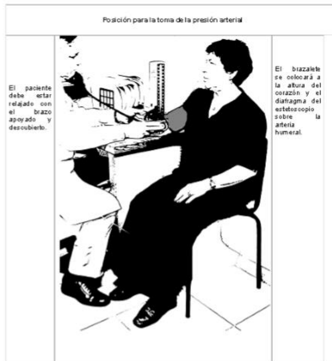
Figura 1. Toma correcta de TA