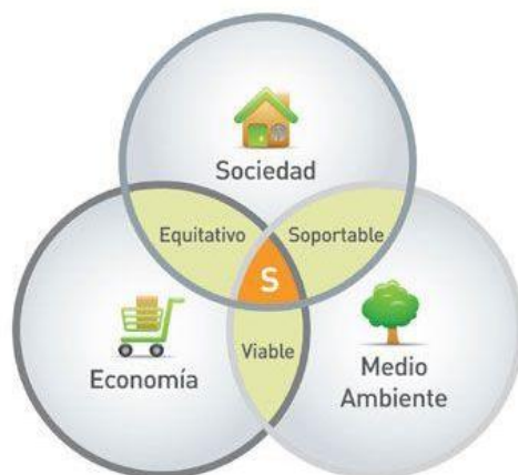
Figura 2 Diagrama de Venn Sostenibilidad

Fuente: Gallopín Guillermo, Sostenibilidad y desarrollo sostenible: un enfoque sistémico 43