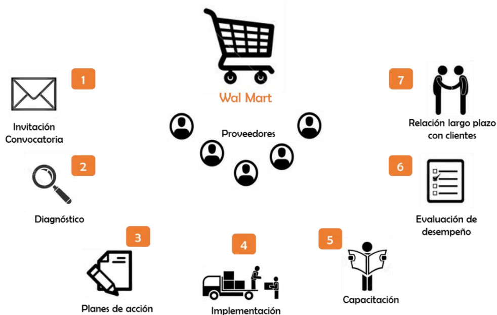
Figura 4 Esquema de trabajo de Fundes en el desarrollo de la Metodología cierre de brechas

Fuente: Mancilla Silvia, Sistematización de la Metodología Cierre de Brechas, México, 2012, sin publicar.