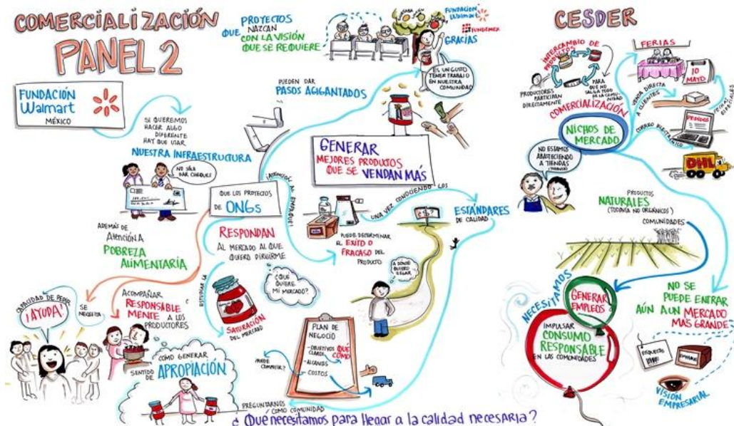
Figura 3 Conclusiones Foro de Intercambio de Experiencias OSC y GDB