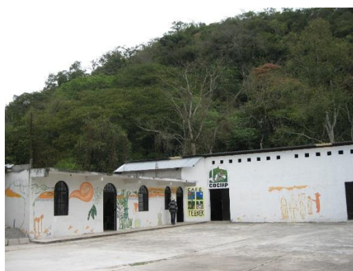
Instalaciones de la COCIPH

Los diagnósticos realizados a cada empresa presentan hallazgos ilustrativos respecto al rol de las organizaciones de la sociedad civil en el impulso a empresas sociales, a las condiciones que se deben impulsar para fortalecerlas además de los retos que se tiene frente a la formación de capacidades (y a la necesidad de optimizar costos).