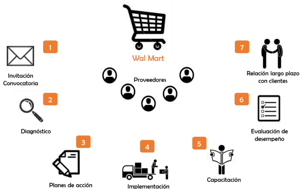
Figura 4 Esquema de trabajo de Fundes en el desarrollo de la Metodología cierre de brechas

Fuente: Mancilla Silvia, Sistematización de la Metodología Cierre de Brechas, México, 2012, sin publicar.