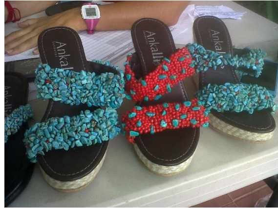
Producto elaborado por Ankalli