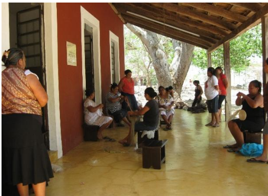
Talleres Cooperativa Kichpan Coole