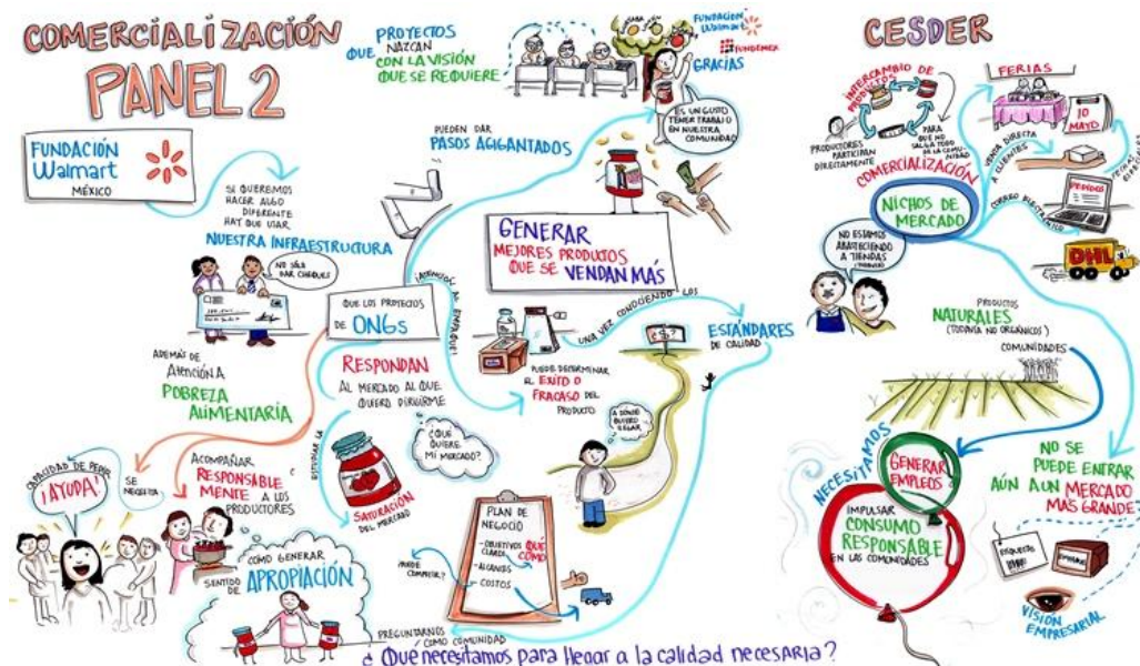
Figura 3 Conclusiones Foro de Intercambio de Experiencias OSC y GDB