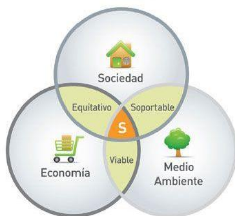
Figura 2 Diagrama de Venn Sostenibilidad

Fuente: Gallopín Guillermo, Sostenibilidad y desarrollo sostenible: un enfoque sistémico 43