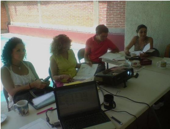
Miembros de la empresa Ankalli