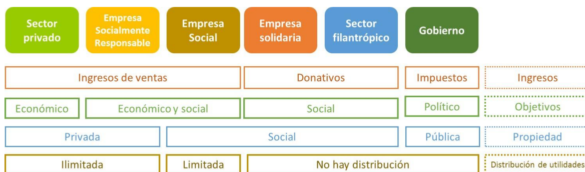
Figura 1 Tipos de Empresas sociales