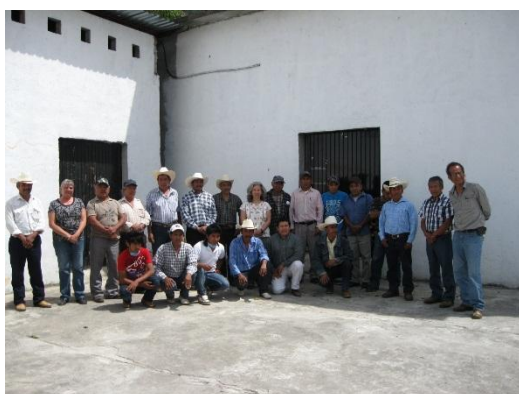
Miembros de la COCIPH durante las capacitaciones de Fundes