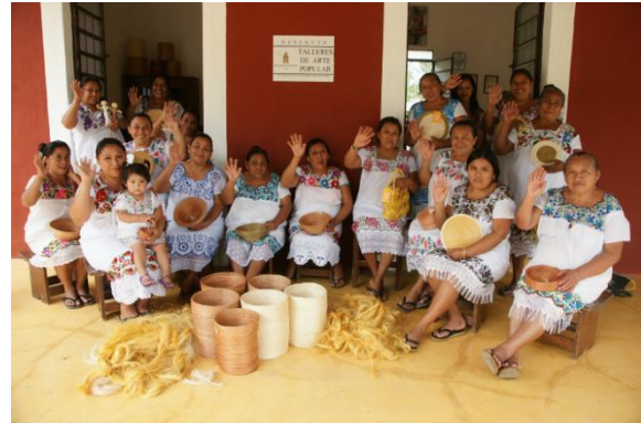
Mujeres miembros de Kichpan Coole