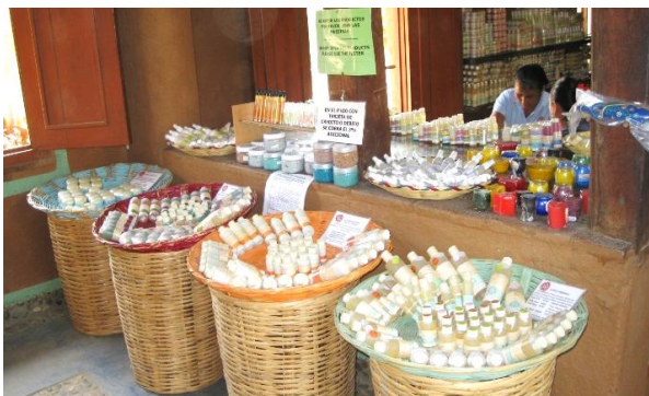
Tienda de cosméticos Mazunte