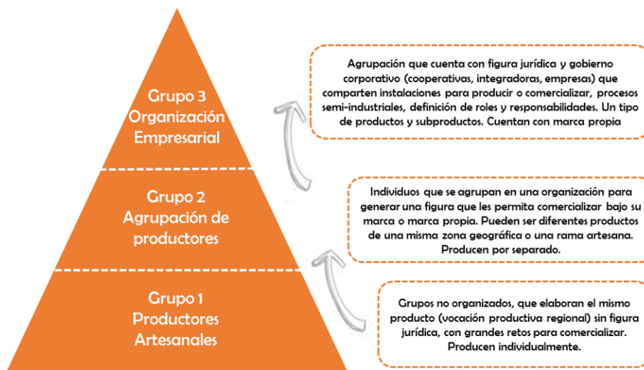
Figura 5 Pirámide de producción artesanal