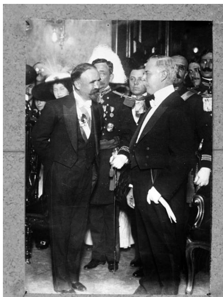
9) Francisco León de la Barra entrega el poder a Francisco I. Madero en Palacio Nacional, repografía , Núm. de inventario 33497, Archivo Casasola, Fototeca Nacional del INAH. Imagen tomada del sitio de la Fototeca Nacional del INAH: http://www.fototeca.inah.gob.mx/fototeca/ (Fecha de actualización: 24 de noviembre de 2015)