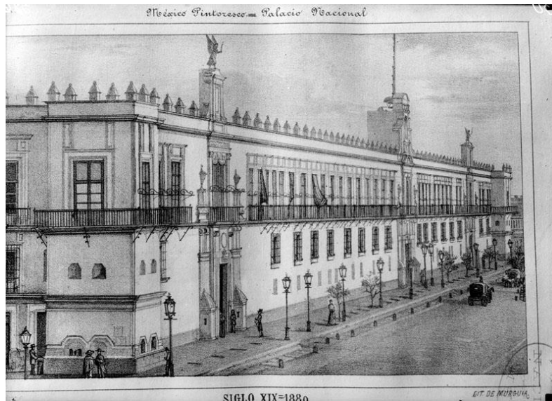
3) México Pintoresco, Palacio Nacional , Núm. de inventario 58, Archivo Casasola, Fototeca Nacional del INAH. Imagen tomada del sitio de la Fototeca Nacional del INAH: http://www.fototeca.inah.gob.mx/fototeca/ (Fecha de actualización: 24 de noviembre de 2015)