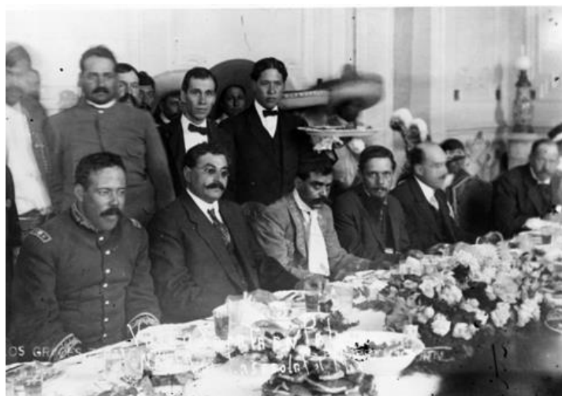
13) Villa y Zapata durante un banquete ofrecido por Eulalio Gutiérrez en Palacio Nacional , Núm. de inventario 63467, Archivo Casasola, Fototeca Nacional del INAH. Imagen tomada del sitio de la Fototeca Nacional del INAH: http://www.fototeca.inah.gob.mx/fototeca/ (Fecha de actualización: 24 de noviembre de 2015)