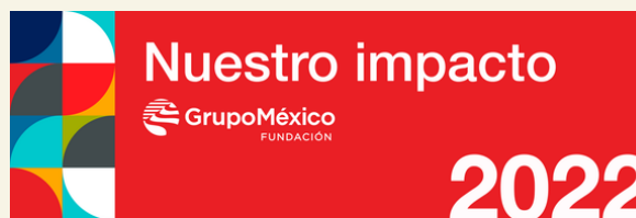
IMAGEN11: Grupo México (Anónimo, 2022)

Otra opción de agente privado es la Fundación Grupo México que se encarga de otorgar donativos para la ejecución de obra y proyectos a través de una convocatoria donde se necesita identificar el area de experiencia, presentar la propuesta, realizar una entrevista con la fundación y si es aprobado se propone una cita para la grabación. Imagen 11.