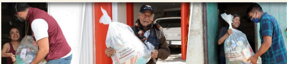
IMAGEN5: Entrega de los apoyos, por parte del Programa Especial y Emergente Alimentario "Puebla contigo", casa por casa. (Gobierno de Puebla, 2022)

Otra acción detectada fue por parte del Gobierno estatal, en donde se creó el Programa Especial y Emergente Alimentario "Puebla contigo". Este fue diseñado para contribuir a una alimentación correcta en personas con condiciones de vulnerabilidad en el estado de Puebla afectados por el Virus COVID19 en 2020. En donde se recibieron apoyos alimentarios de este programa en 217 Municipios del Estado, en zonas con condiciones de vulnerabilidad, afectados por el virus COVID-19, la entrega de los apoyos fue dada directamente, es decir, casa por casa. Imagen 5