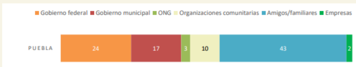
GRAFICO1: Tipo de apoyos que recibieron los hogares de Puebla. (Galicia, M. & Meléndez, J. Encuesta de Seguridad Alimentaria y Alimentación en México, 2021)

Se han intentado resolver varias causas y efectos del problema planteado de distintas partes entre las cuales se destaca; Apoyos alimentarios que se otorgaron en Puebla a través del DIF estatal, esto fue realizado durante la segunda oleada de COVID en el 2020, en donde Puebla también recibió apoyo de la Agencia Mexicana de Cooperación Internacional para el Desarrollo (AMEXID). Sin embargo, se encontró que no toda la población fue beneficiada y solo el 55% de los hogares en Puebla recibieron algún tipo de apoyo, dejando al otro 45% de los hogares en el olvido. De acuerdo con los datos de la encuesta realizada se identifica que los apoyos provenían principalmente de los amigos y familiares (Grafico 1) mostrando el apoyo solidario hacia los entrevistados, ayudando con alimentos, dinero o préstamos lo cual deja en evidencia la importancia de las redes y su potencial como capital social para enfrentar situaciones de crisis. Lo anterior reafirma las evidencias presentadas en la sección de estrategias, donde una de las principales, fue la solicitud de préstamos a familiares y/o amigos. En conclusión se puede decir que este intento solo fue útil para el 55% de los hogares en Puebla, puesto que el 45% restante aun padece de inseguridad alimentaria.