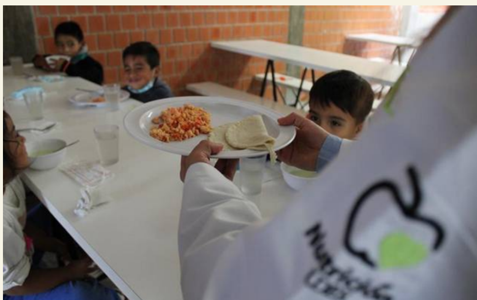
IMAGEN4: Desnutrición y carencia alimentaria en Puebla