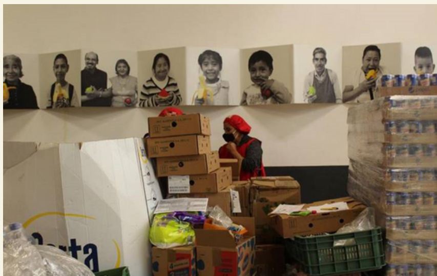
Imagen 3: Covid-19 provoca alza en canasta básica e inseguridad alimentaria (Díaz, B. | Sol de Puebla, 2020)

“El alza de precios fue una situación económica muy difícil para las personas en pobreza extrema y para aquellos que perdieron su empleo o están gastados por los tratamientos del virus Sars-Cov-2” informo el director general del Banco de Alimentos Cáritas en Puebla (2020). (Díaz, B., 2020), Imagen 3.