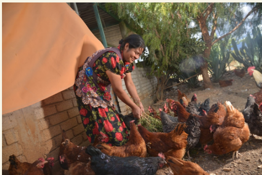
IMAGEN6: La Fundación Heifer impulsa el proyecto Hatching Hope | Especial (Anónimo | milenio, 2022)

Situación que empeora, debido al limitado o ausente contacto con veterinarios para la detección temprana de las enfermedades. Haciendo que este proyecto no sea en su totalidad viable pues por una parte beneficia a las familias pero si no se logra tener el cuidado y área que requieren estos animales a la larga terminaría perjudicando a este grupo ya vulnerable.