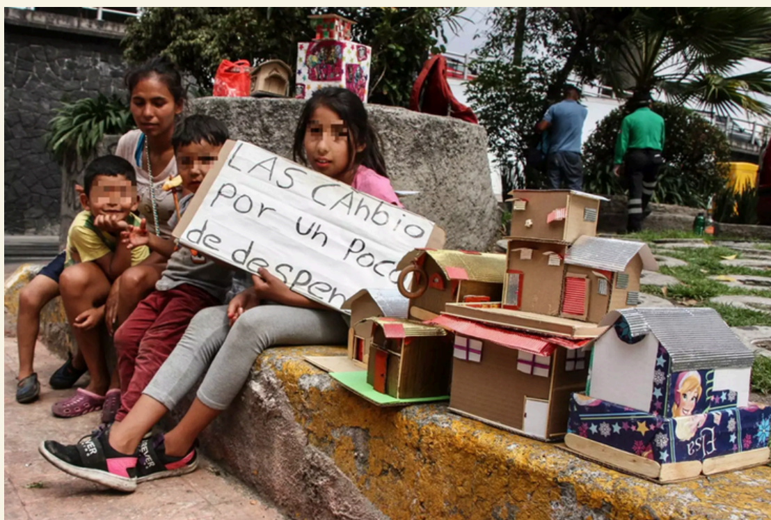
IMAGEN2: Los hogares con niñas, niños y adolescentes sufren mayores afectaciones económicas, psicológicas y sociales por la pandemia, (cuartoscuro | expansión política, 2020)

Con lo anterior podemos decir que la inseguridad alimentaria provoca una inestabilidad social, política y económica, pues surge cuando las personas carecen de acceso seguro a una cantidad de alimentos suficientes para el crecimiento y desarrollo normal para las personas. (Cuartoscuro, 2020.) Imagen 2