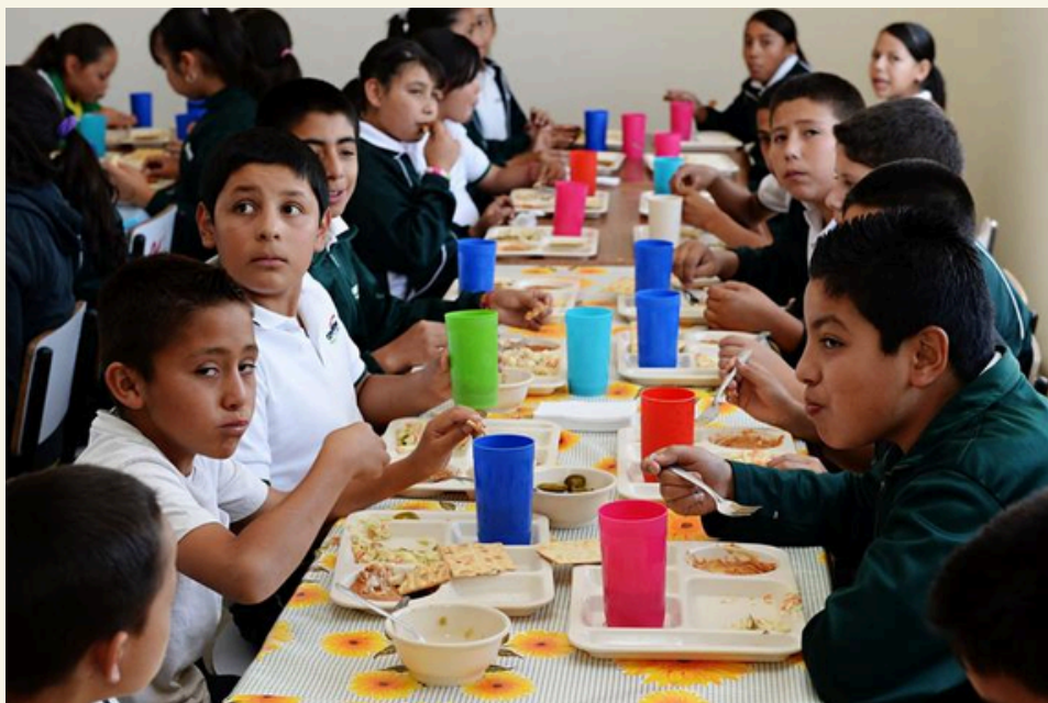
IMAGEN8: Desayuno Escolar que se ofrece por parte del DIF (Maldonado, S. 2022).

Es un proyecto que ha contribuido en disminuir la Inseguridad alimentaria y desnutrición en los niños que asisten a la escuela, sin embargo deja muchos otros niños en estado de desnutrición e inseguridad alimentaria, además de que al solo dar desayunos no asegura que los niños también consumirán algún otro alimento en el transcurso del día, puesto que algunas veces el desayuno dado en las instalaciones escolares es el único alimento que consumen en el día. haciendo que este proyecto solo beneficie a un grupo vulnerable en un momento del día. Imagen 8