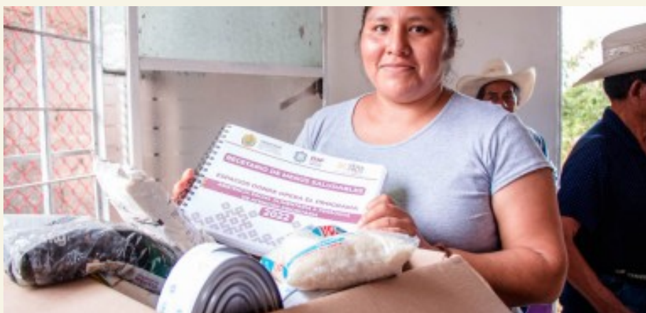
IMAGEN7: Entrega de insumos por parte del programa Atención Alimentaria a Grupos Prioritarios (Anónimo, 2022).

A nivel nacional el problema de inseguridad alimentaria también se ha intentado resolver. Un intento de solución es el programa de Asistencia Social Alimentaria a Personas de Atención Prioritaria en el 2022 por parte del Gobierno de la Republica. En donde los esquemas recomendados para la operación del Programa de Asistencia Social Alimentaria a Personas de Atención Prioritaria en su modalidad de entrega de dotaciones alimentarias y de entrega de raciones en espacios alimentarios, consistía en que cada estado iba a poder sus adaptar sus dotaciones de acuerdo con su contexto y necesidades. Además, la dotación para niños de 2 a 5 años 11 meses no escolarizados deberá estar conformada por al menos 7 insumos diferentes con base en estos criterios y que formen parte de la cultura alimentaria de los beneficiarios. Sin embargo, SEDIF deberá elaborar y entregar solamente 40 menús cíclicos con 2 diferentes diseños para niños de 2 a 5 años 11 meses no escolarizados, dejando a la demás población sin este tipo de apoyo, pues solo tenían contemplado a niños de esta edad. Imagen 7