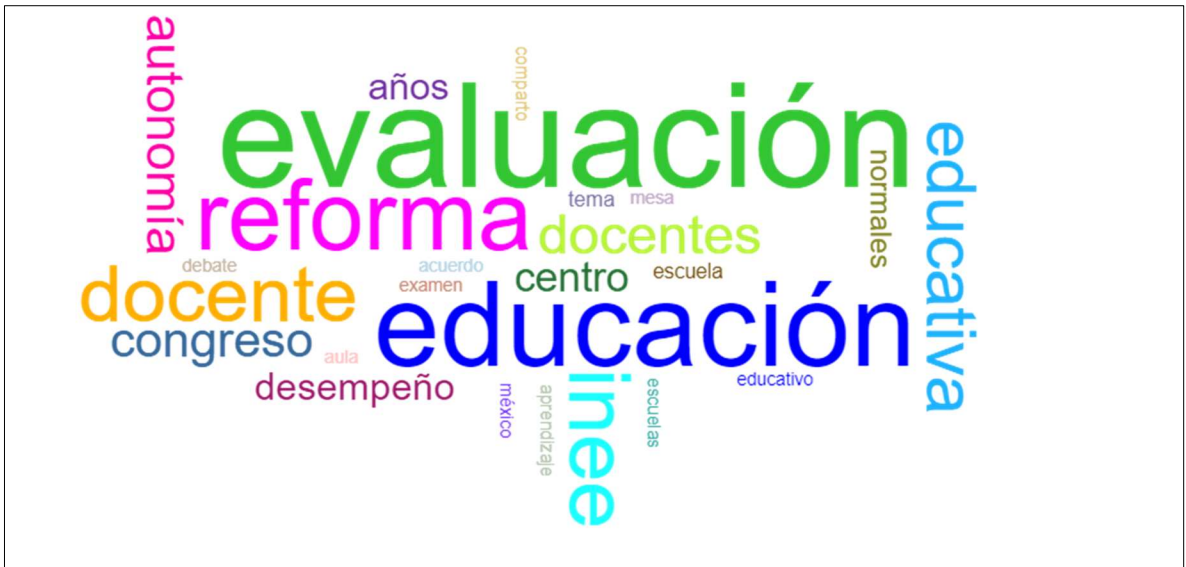
Figura 7. Nube de palabras del corpus de 110 tuits, con Voyant tools

Los usos que hace dentro de esta red social se pueden clasificar según dos tipos de objetivos: (1) tuits para expresar opinión sobre noticias o acontecimientos (78 tuits); (2) tuits para hacer publicidad sobre eventos académicos (32). Los primeros, a su vez, se pueden clasificar en tuits que hacen referencia a un texto que el lector encuentra con un enlace; y tuits que hacen referencia a un acontecimiento, pero no a un texto específico.