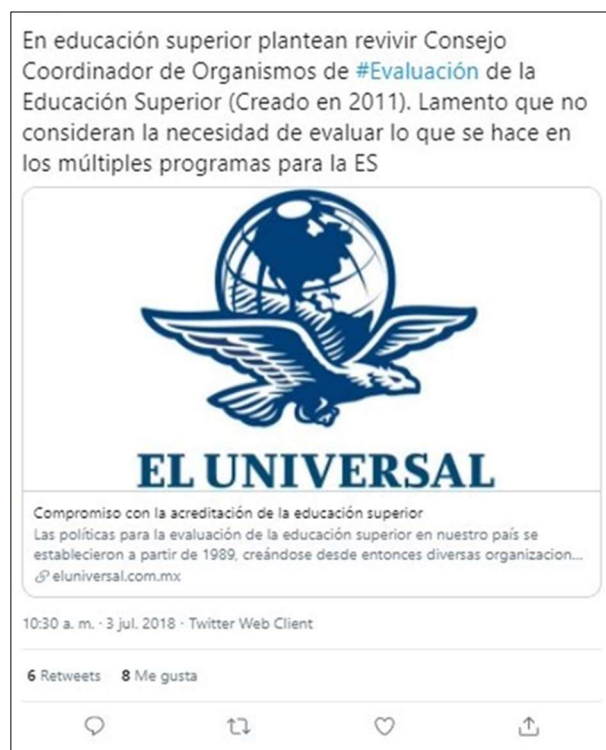
Figura 3. Ejemplo de referencia a un artículo de periódico (tuit 14)