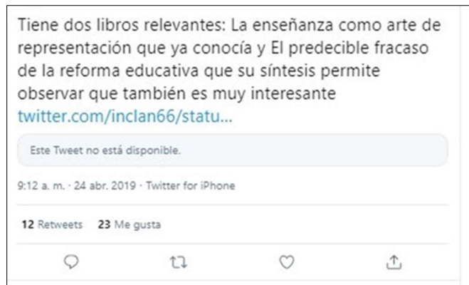
Figura 2. Ejemplo de referencia a libros (tuit 102)