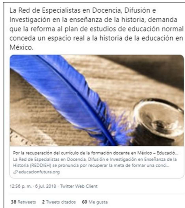
Figura 6. Ejemplo de referencia a una plataforma digital (tuit 16)

Ahora, sobre la temática o las temáticas que el investigador aborda en Twitter, se observó que éste comenta acontecimientos o noticias relacionadas con el ámbito educativo de México. De hecho, este interés temático del investigador se puede observar a través de la nube de palabras que se presenta a continuación (figura 7): usando el corpus de 110 tuits, se empleó el software https://voyant-tools.org/ (mismo software empleado por Magallón-Rosa, 2018) y se generó una nube con las 25 palabras más frecuentes. Además, al contar las veces en que aparecen las cinco palabras más frecuentes se conoce que son: evaluación (43); educación (31); reforma (25); inee (21); docente (19).