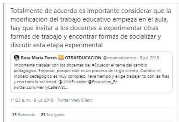
Figura 5. Ejemplo de referencia a una cuenta de otro usuario (tuit 18)