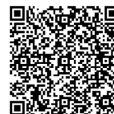
Figura 4. QR de la guía final sobre alimentación de pacientes en cuidados paliativos por cáncer para cuidadores no formales