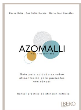
Figura 3. Portada final de la guía sobre alimentación de pacientes en cuidados paliativos por cáncer para cuidadores no formales

En la última etapa, a partir de las recomendaciones, se modificó ortografía, redacción y tipografía, se añadieron imágenes, logo de la universidad y revisores, se cambió de capítulos a secciones y la información se sintetizó, permitiendo la fácil comprensión de la guía para los cuidadores (Figura 3 y 4).