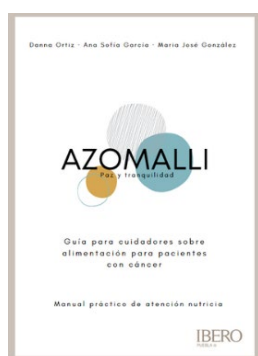
Figura 3. Portada final de la guía sobre alimentación de pacientes en cuidados paliativos por cáncer para cuidadores no formales

En la última etapa, a partir de las recomendaciones, se modificó ortografía, redacción y tipografía, se añadieron imágenes, logo de la universidad y revisores, se cambió de capítulos a secciones y la información se sintetizó, permitiendo la fácil comprensión de la guía para los cuidadores (Figura 3 y 4).