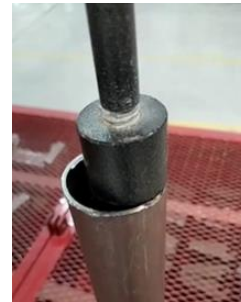
Fig. 2. Molde y pisón

Una vez contando con un pisón de densidad, se vio que esta tenía el diámetro necesario no solo para que entrara en el molde, sino que también estaba por debajo de la medida del diámetro interno, haciendo que entrara y saliera sin problema y aplastara la mezcla a uniformemente (Fig. 2).