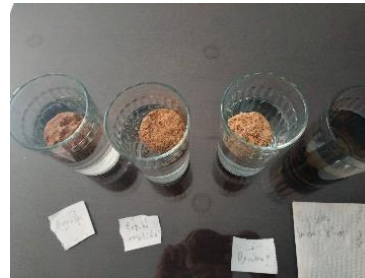
Fig. 11. Briquetas en agua pasada las primeras 24 hrs

Después del primer lapso de 24 hrs, las briquetas hechas con cera de soya siguieron estando al flote, se tomó su peso y si hubo un cambio en su masa, al igual que en el segundo día y tercero, pero la briqueta hecha en el proyecto de Yeknemilis fue la que demostró un mayor cambio en su masa interna. El porcentaje de absorción de las briquetas se calculó.