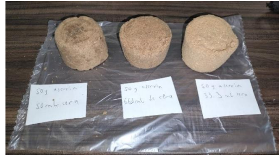
Fig. 1. Briquetas moldeadas cortas de 2x2 in de diámetro y altura

Se fijó una base de gramaje del aserrín que se utilizará por la capacidad que tiene el tubo metálico con las medidas que ya se habían establecido previamente, para la fécula de maíz se estableció teóricamente gracias a distintas patentes, pero la variable que iba a cambiar era la cera de soya por lo que se hicieron pruebas a escala con proporciones en un rango entre 30 mL a 60 mL. Se usaron como moldes vasos dando como resultado la Fig. 1. En la imagen se puede ver las diferentes proporciones que se utilizaron, se hicieron a escala para no desperdiciar material.