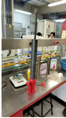
Fig. 3. Pisón para concreto encajado encima del gato hidráulico para sacar la briqueta del molde.