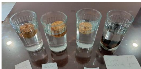
Fig. 10. Briquetas en agua para prueba de absorción

Lo que es referente a la prueba de absorción, se trata de verificar cuánta agua puede absorber una muestra de briqueta al estar sumergida en agua por 24 hrs o por cierto lapso de tiempo, lo cual se hizo con las muestras de briqueta disponible. Se tomó una muestra de briqueta de aserrín, dos de bambú que hicimos con la misma metodología de las de aserrín (una con el aserrín de bambú como se proporcionó y otra con el bambú molido) y un pedazo de la briqueta de bambú que se produjo con briquetadora industrial. Estas se pusieron principalmente por 24 hrs en 300 mL de agua, pero inmediatamente a los 1-2 minutos de que iniciara la prueba, la muestra de bambú industrial cayó al fondo del recipiente con agua, mientras que todas las demás briquetas que producidas se mantuvieron a flote en la superficie del agua, como se muestra en la Fig. 10.