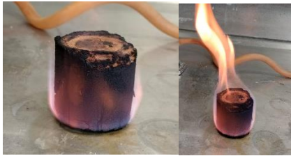
Fig. 6 y 7. Muestra de briqueta entrando en combustión

Con respecto a la combustión, se pudo confirmar que las muestras de briqueta del aserrín/polvo de madera de la universidad, con la cera de soya y la maicena pueden entrar en combustión al entrar en contacto con el fuego, como se observa en la Fig. 6 y 7.