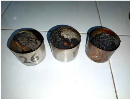
Fig. 9. Briquetas después de pasar por mufla

Después de que salieran de la mufla (Fig. 9), las muestra mostraron quemarse por las altas temperaturas, pero su masa cambio drásticamente al estar expuestas a temperaturas altas, los resultados se indican en la Tabla 3.