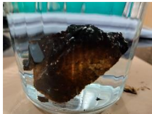
Fig. 13. Briquetta de proyecto de Yeknemilis bajo 300 mL de agua

En cuanto a los resultados finales obtenidos, la briquetta de del proyecto de Yeknemilis demostró ser la más expuesta en absorber humedad con un porcentaje de absorción de 44.03 % en solo el primer día (Fig. 13), mientras que las otras de aserrín del IDIT y de bambú solas con un porcentaje del 24.29 %, la briquetta hecha del mismo bambú, pero molida a una granulometría menor por otro lado, demostró ser mucho más impermeable al agua, con un porcentaje de absorción de solo 7.49 %.