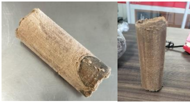
Fig. 4 y 5. Briquetas presionadas sacadas del molde

Con respecto a la combustión, se pudo confirmar que las muestras de briqueta del aserrín/polvo de madera de la universidad, con la cera de soya y la maicena pueden entrar en combustión al entrar en contacto con el fuego, como se observa en la Fig. 6 y 7.