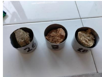
Fig. 8. Briquetas para prueba de materia volátil