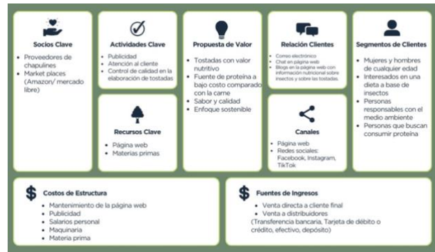
Fig. 4. Modelo Canvas Tostadas DelGrillo.

sostenibles a base de chapulín, inspirando un cambio significativo en los hábitos de consumo y promoviendo un estilo de vida más saludable y respetuoso con el planeta. Valores: Calidad, sostenibilidad, responsabilidad, impacto social, innovación y transparencia.