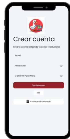
Fig 3: Inicio de sesión para la aplicación IBERO Commerce donde se debe registrar con correo institucional

Esta es la primera sección para dar ingreso a la aplicación, con el registro del correo institucional y datos del estudiante.