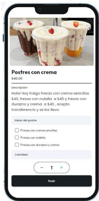
Fig 5: Página de descripción y venta de producto en la aplicación IBERO Commerce

En esta sección se selecciona el producto que se desea comprar y a continuación aparecerá la descripción del producto, una imagen de este, su precio y la cantidad que se gusta comprar.