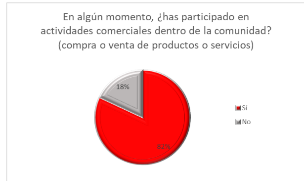
Fig 1: Porcentaje de personas que participan en actividades comerciantes dentro de la UIA

Primero se midió el nivel de compra – venta de los estudiantes para conocer el ritmo de la actividad comercial, esto ayudó a concluir que existe un mayor porcentaje de compra de productos que de estudiantes emprendedores; las razones de esta diferencia es la existencia de limitaciones de tiempo, ya que algunas personas no disponen de tiempo para crear y administrar un negocio, también podría ser por falta de recursos, falta de orientación y de apoyo.