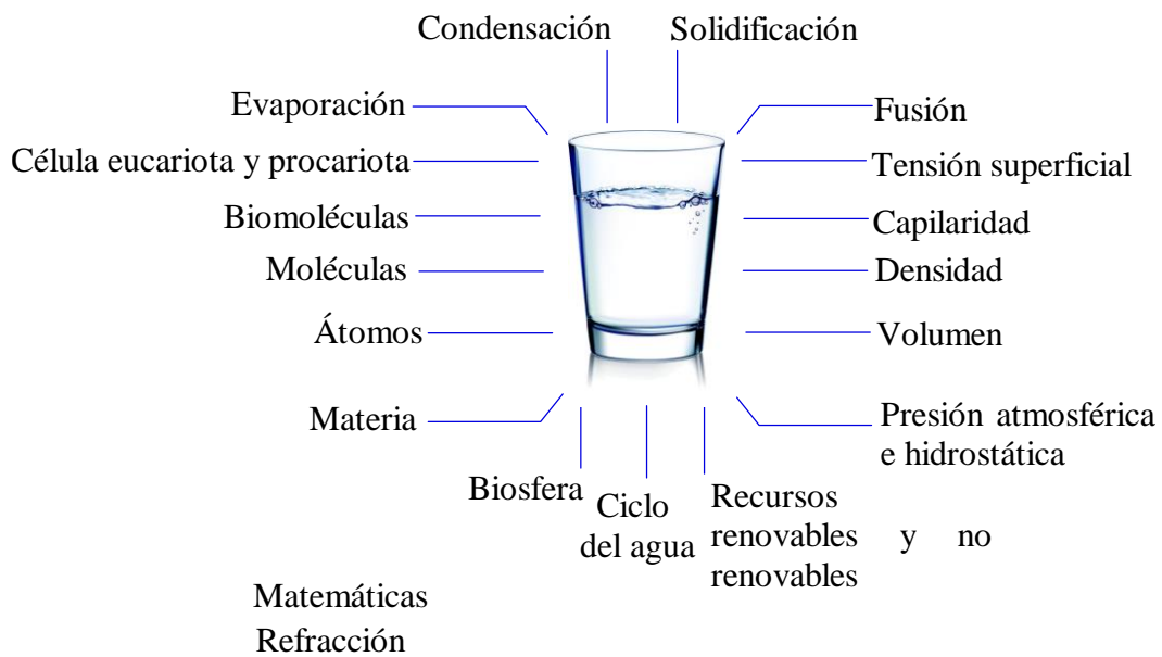
Figura 1. Los conceptos que pueden discutirse a partir de un vaso de agua.