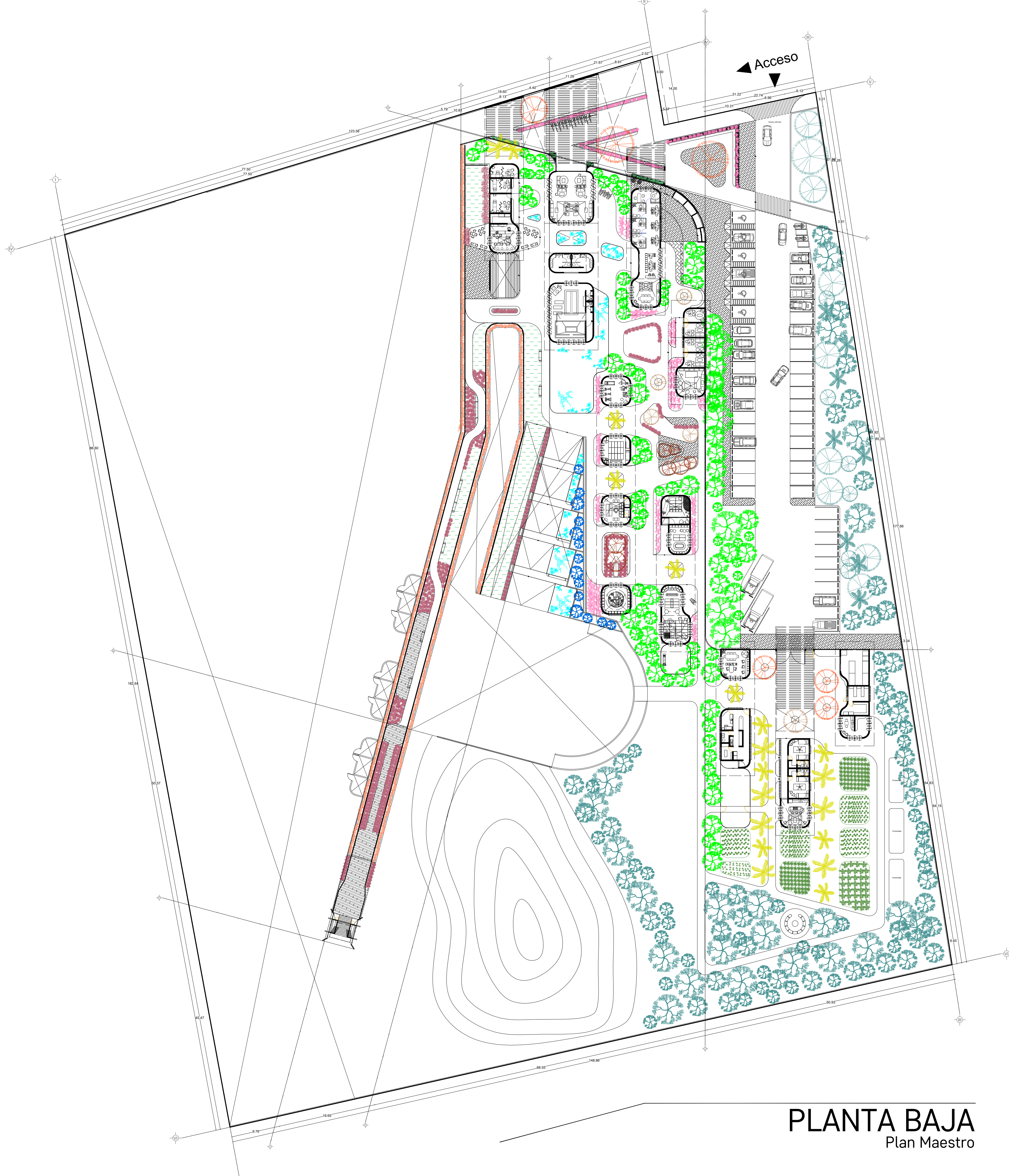
PLANTA BAJA Plan Maestro