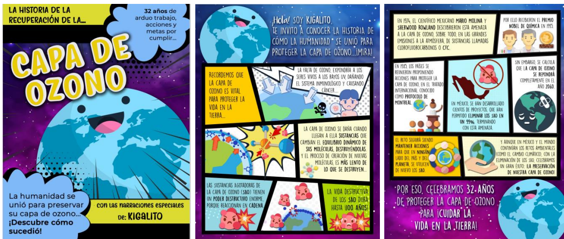
Figura 6. Comic analizado

Con la finalidad de sensibilizar, despertar su curiosidad e interés en ésta fase y así poder realizar la investigación pertinente, se presentó el comic “La capa de ozono”, el cual se leyó en equipos y se comentó sobre su contenido.