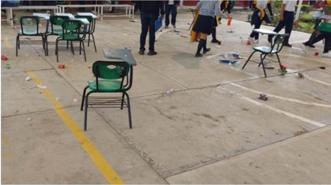
Figura 12. Fotografía de la cancha de la escuela.