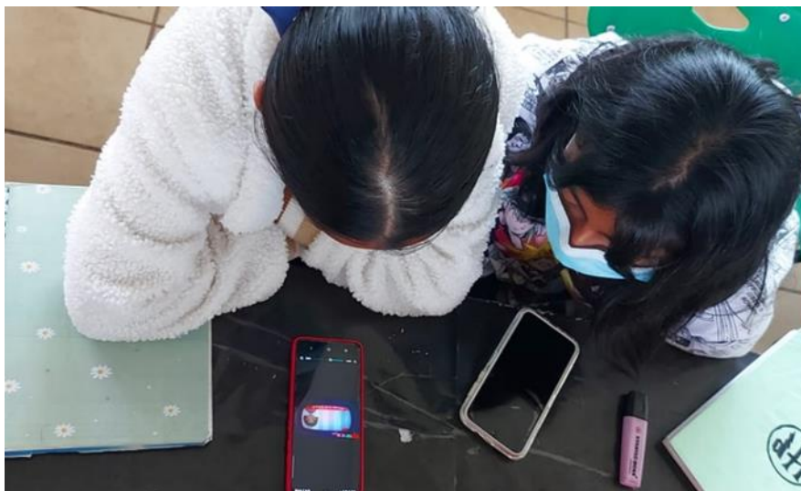
Figura 9. Alumnas creando su cortometraje en su dispositivo móvil