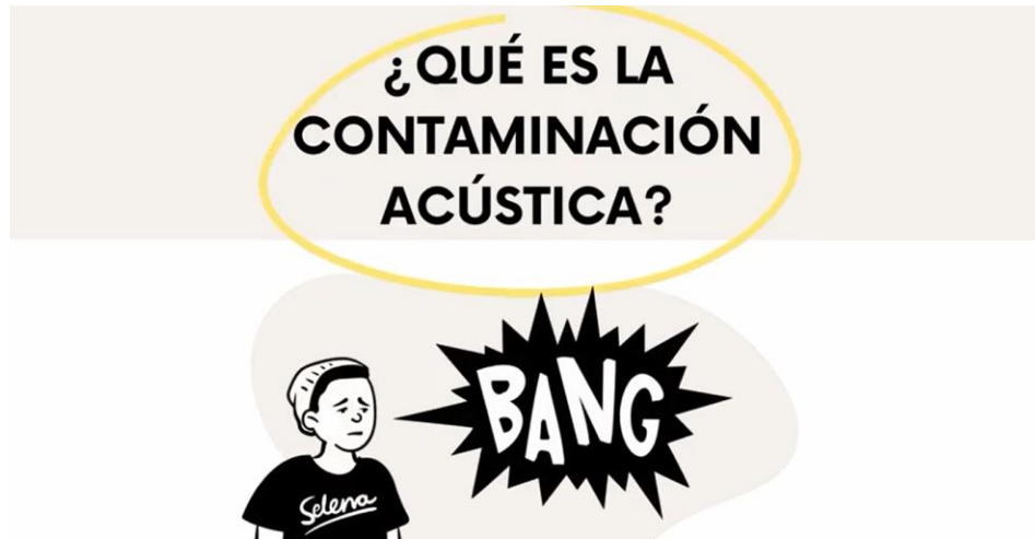
Figura 11. Imagen del video para hablar sobre la contaminación acústica.