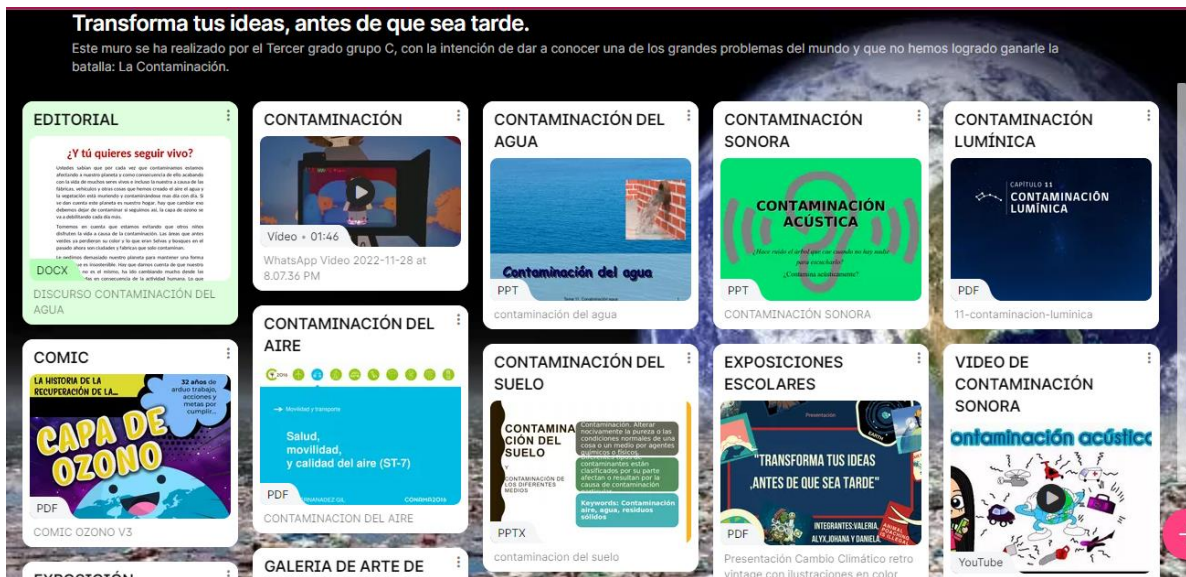
Figura 13. Padlet de la clase.

En la figura 13 se puede evidenciar el Padlet en donde se organiza todo lo que se trabajó y realizó con respecto al tema de la contaminación, este se puede ver en: https://padlet.com/gracygar03/ophqykkhriq4f5zu