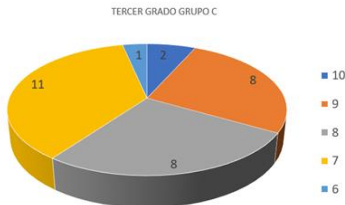
Figura 15. Gráfica que representa en calificación numérica

Como se puede observar la mayoría de los alumnos se encuentran con un promedio final que los ubica en el nivel bueno, puesto que el promedio final es de 8.5