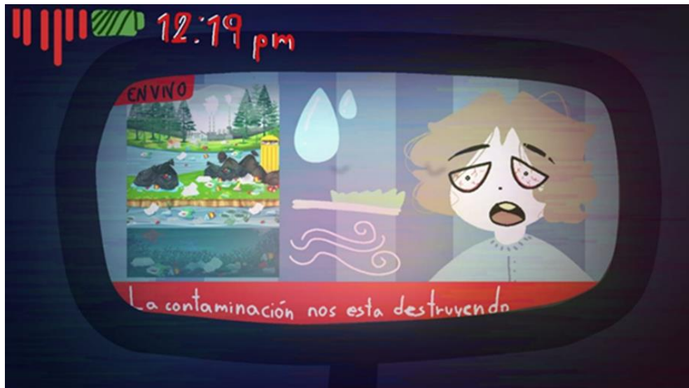
Figura 8. Imagen de cortometraje

Los alumnos propusieron elaborar un cortometraje en el que se muestran las consecuencias de lo que puede pasar con la contaminación en nuestra vida, sino tomamos medidas urgentes y hacemos algo para salvar nuestro planeta, nuestro hogar.