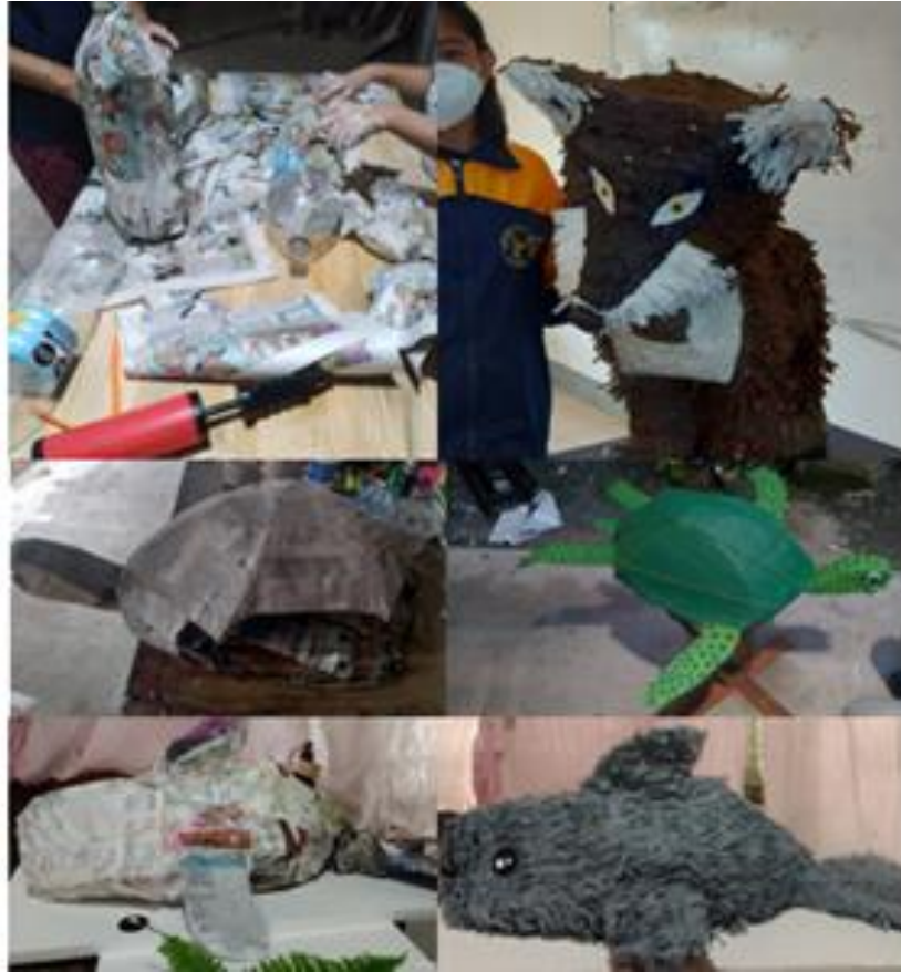
Figura 10. Elaboración de piñatas de animales en peligro de extinción.

En la figura se muestra que para la elaboración de sus animales en peligro de extinción que fueron elaborados por los alumnos, y se pretende mostrar que por causas de la contaminación podemos perder esas especies y para dar muestra de que se puede reutilizar, se elaboraron con materiales reutilizables de su entorno, como periódico, cartón, hojas recicladas, botellas de plástico desechables, engrudo etc.