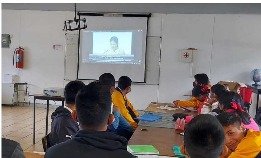
Figura 3. Evidencia de proyección del video

En ésta primera fase, para poder atrapar la atención de los adolescentes se proyecta el video: Severn Suzuki: La Niña que Silencio al Mundo por 6 Minutos que se puede consultar en la liga: https://www.youtube.com/watch?v=XXENDIIdu2E&t=1s en el cual los alumnos muestran interés y sorpresa al saber la fecha en la que se llevó a cabo el discurso de la adolescente y la preocupación que tenían desde ese tiempo a la actualidad, se sintieron identificados por la problemática presentada y se conectaron con el discurso de la señorita puesto expresan que en la actualidad se sigue viviendo la misma problemática y se sensibilizaron con la problemática que se presenta.