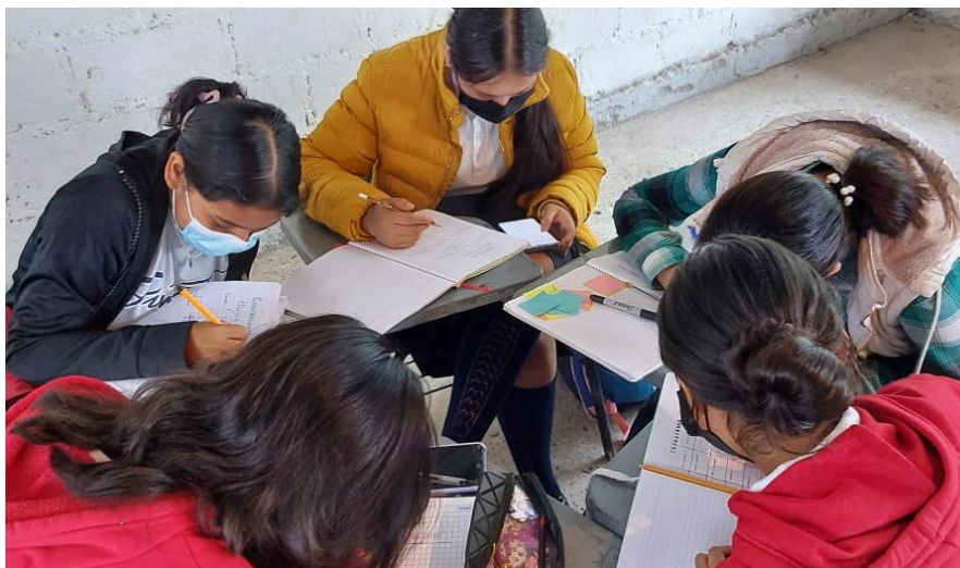
Figura 7. Trabajo en equipos de investigación

Se organizan en equipos como lo hicieron anteriormente con la lectura del comic y comienzan con la planeación de las actividades en las que cada uno se hace responsable de alguna actividad específica o todos la realizan, de acuerdo con su organización y a su cronograma de actividades.