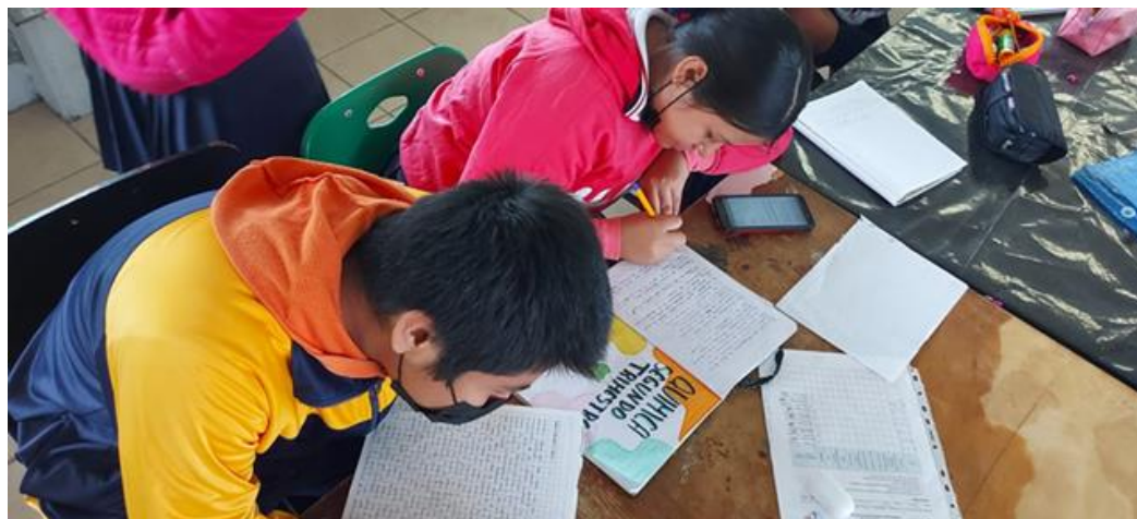
Figura 14. Elaboración del discurso

Los alumnos se propusieron elaborar un discurso reflexivo sobre la importancia de cuidar nuestro planeta y de emprender acciones inmediatas por el bien de nuestro planeta y de nosotros mismos.