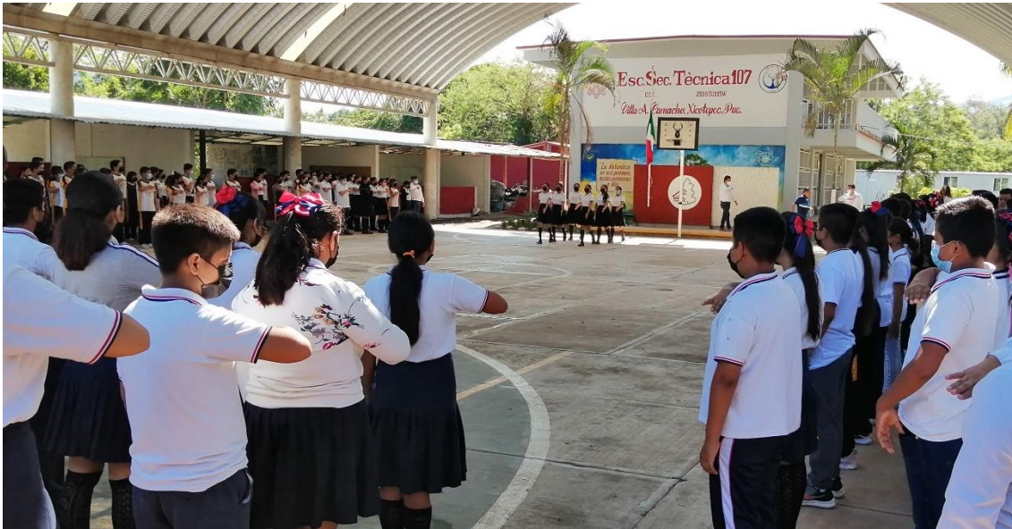
Figura 1. Fotografía de la Escuela Secundaria Técnica 107.

En la imagen se puede observar parte de las instalaciones y el alumnado que integra la institución, durante una ceremonia cívica. Tomada durante el evento cívico, el 15 de septiembre de 2022.